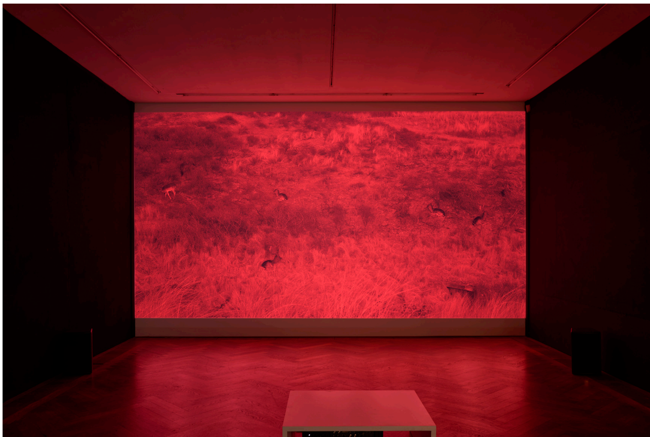
Installationsansicht, Regionale 22, ... von möglichen Welten, Kunsthalle Basel, 2021, Blick auf Tatjana Stürmer, Death by Landscape , 2021. Installation view, Regionale 22, ... von möglichen Welten, Kunsthalle Basel, 2021, view on Tatjana Stürmer, Death by Landscape , 2021.