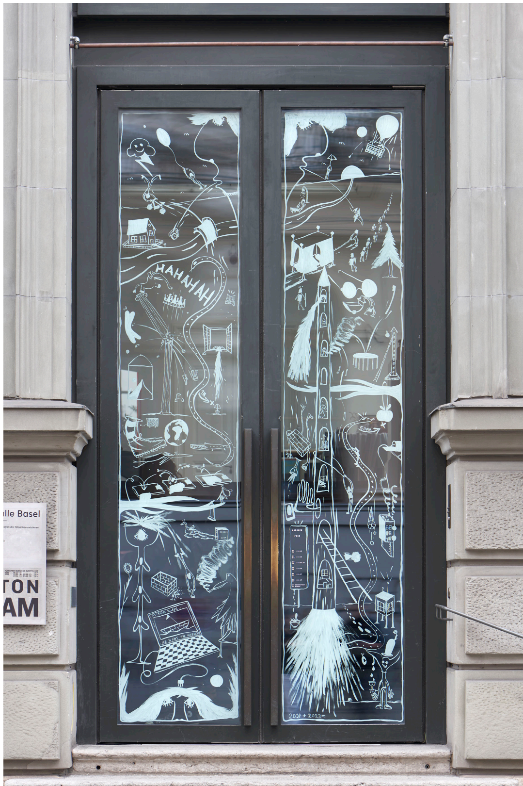
Installationsansicht, Regionale 22, ... von möglichen Welten, Kunsthalle Basel, 2021, Blick auf Fabio Sonogo, Treasure Map Extended , 2021. Installation view, Regionale 22, ... von möglichen Welten, Kunsthalle Basel, 2021, view on Fabio Sonogo, Treasure Map Extended , 2021.

Pressebilder / Press Images Download-Link: kunsthallebasel.ch/presse/