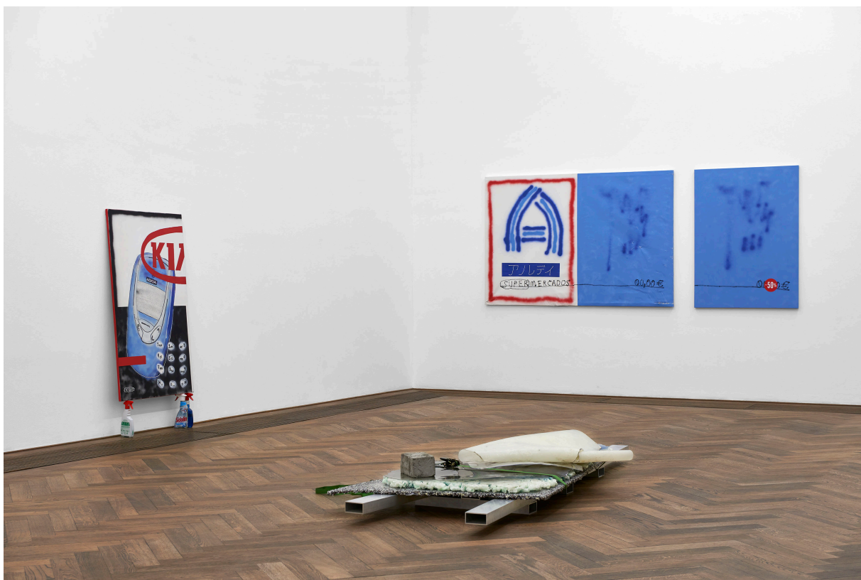
Installationsansicht, Regionale 22, ... von möglichen Welten, Kunsthalle Basel, 2021, Blick auf Remy Erismann, Breakdancer , 2021 (vorne); Basil Ikum, No Kia , 2020 (hinten, links) und SUPER MERCADOS , 2020 (hinten, rechts).