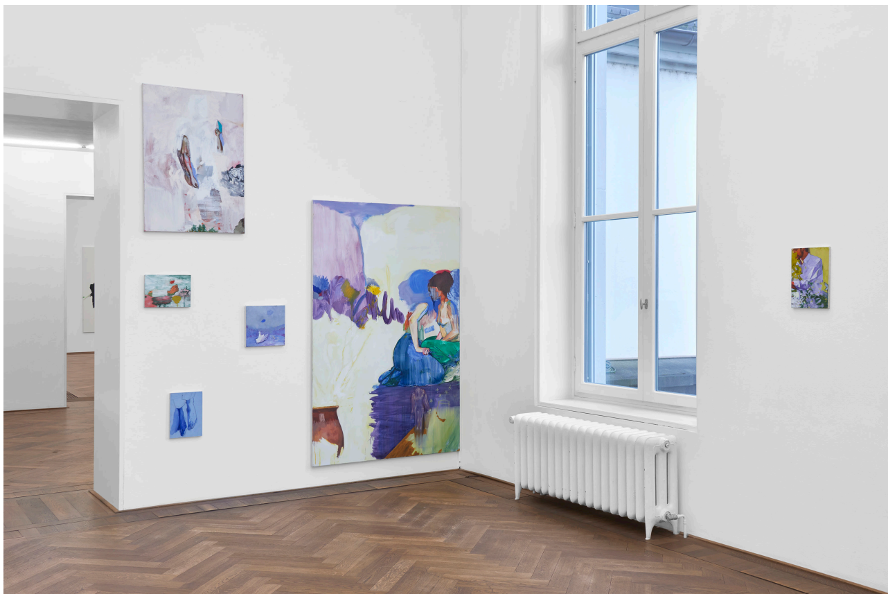
Installationsansicht, Regionale 22, ... von möglichen Welten, Kunsthalle Basel, 2021, Blick auf (v.l.n.r.) Cléo Garcia Leroy, Élie , 2020; Jardin , 2020; Heroes , 2020; Pieds , 2020; Amies , 2021; La Manche , 2020.