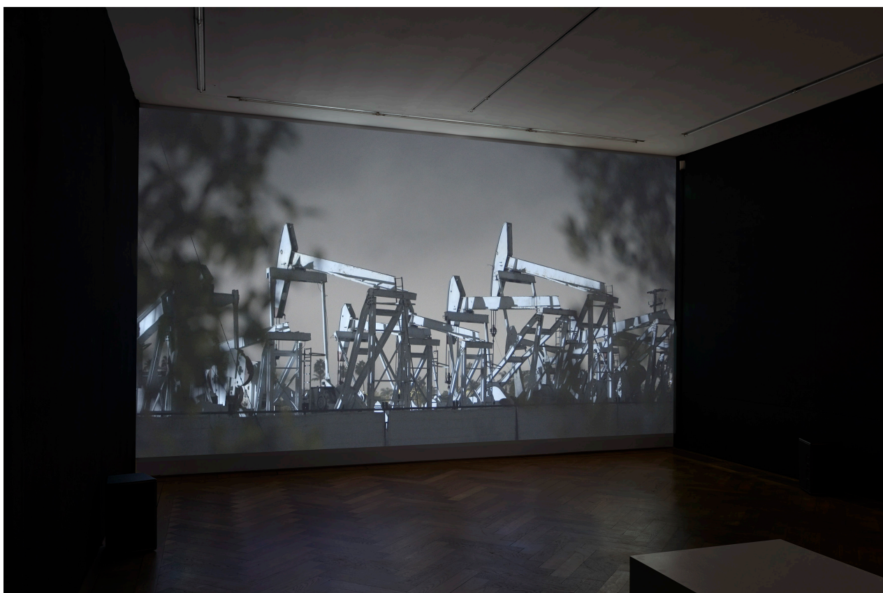
Installationsansicht, Regionale 22, ... von möglichen Welten, Kunsthalle Basel, 2021, Blick auf Işık Kaya & Thomas Georg Blank, Crude Aesthetics , 2021. Installation view, Regionale 22, ... von möglichen Welten, Kunsthalle Basel, 2021, view on Işık Kaya & Thomas Georg Blank, Crude Aesthetics , 2021.