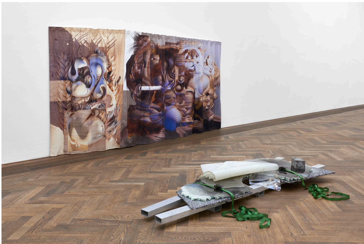
Installationsansicht, Regionale 22, ... von möglichen Welten, Kunsthalle Basel, 2021, Blick auf Remy Erismann, Breakdancer , 2021 (vorne); Tatjana Stürmer, Bread of Dreams , 2020 (links) und Escaping Contours , 2020 (rechts).