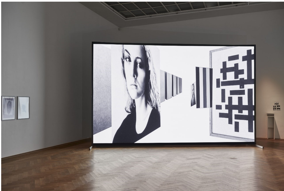
Esther Hunziker, Installationsansicht, Hall , 2017, Exposed Exhibitions – Fotoarchiv der Kunsthalle Basel, Kunsthalle Basel, 2017.