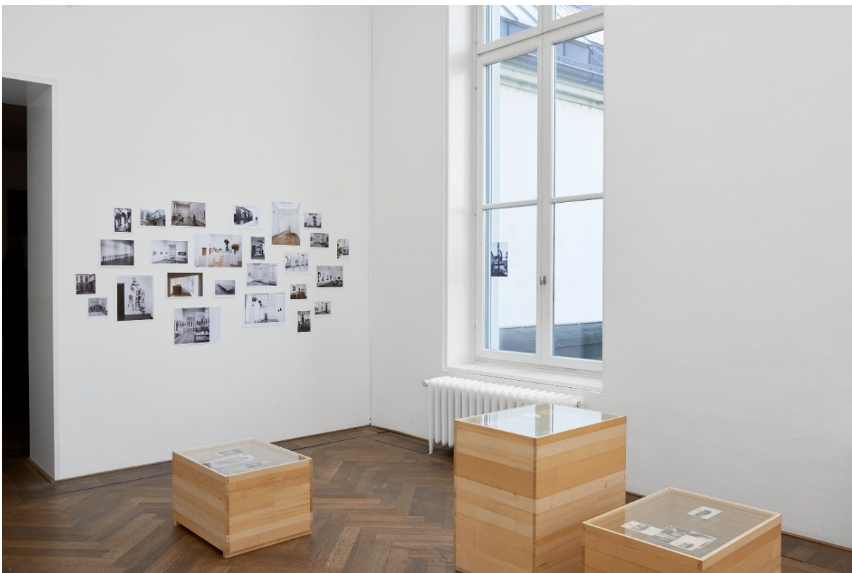
Raoul Müller, Installationsansicht, Forget It , 2013–2017 (vorne) und ausgewähltes Archivmaterial „Raumarchäologie“ (hinten), Exposed Exhibitions – Fotoarchiv der Kunsthalle Basel , Kunsthalle Basel, 2017.

Detail view of selected archival material "Archeology of Rooms," Exposed Exhibitions – Fotoarchiv der Kunsthalle