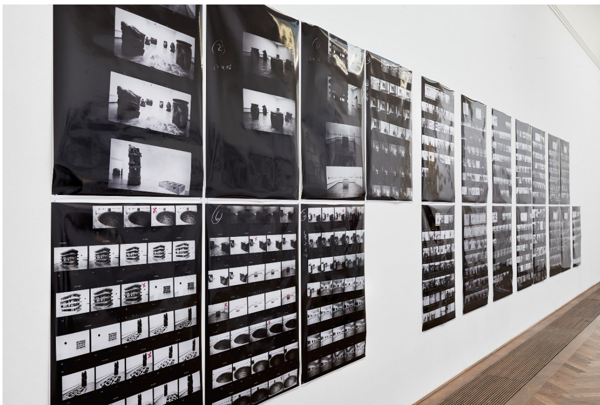
Installationsansicht von ausgewähltem Archivmaterial „Kontaktabzüge“, Exposed Exhibitions – Fotoarchiv der Kunsthalle Basel , Kunsthalle Basel, 2017.

Installation view of selected archival material "Contact Sheets," Exposed Exhibitions – Fotoarchiv der Kunsthalle Basel , Kunsthalle Basel, 2017.