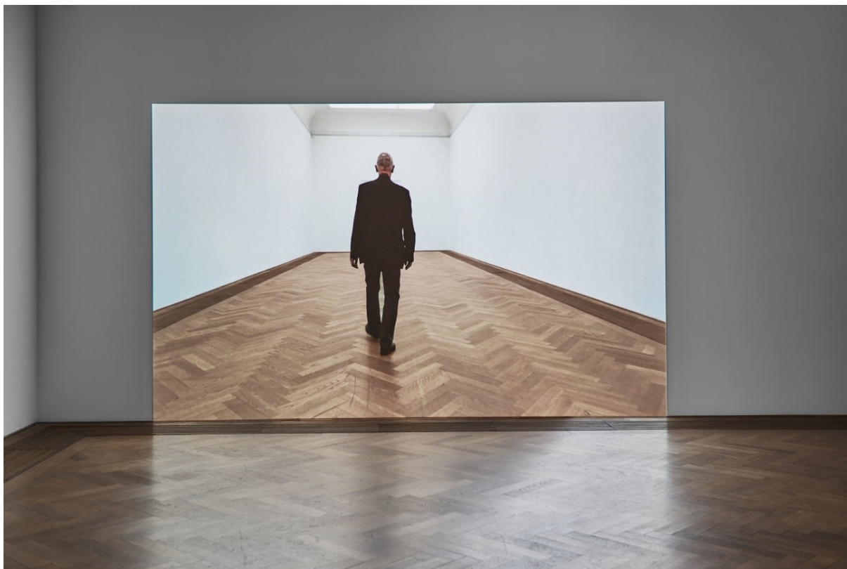
Werner von Mutzenbecher, Installationsansicht, Kunsthallefilm II / 2017 , 2017, Exposed Exhibitions – Fotoarchiv der Kunsthalle Basel, Kunsthalle Basel, 2017.