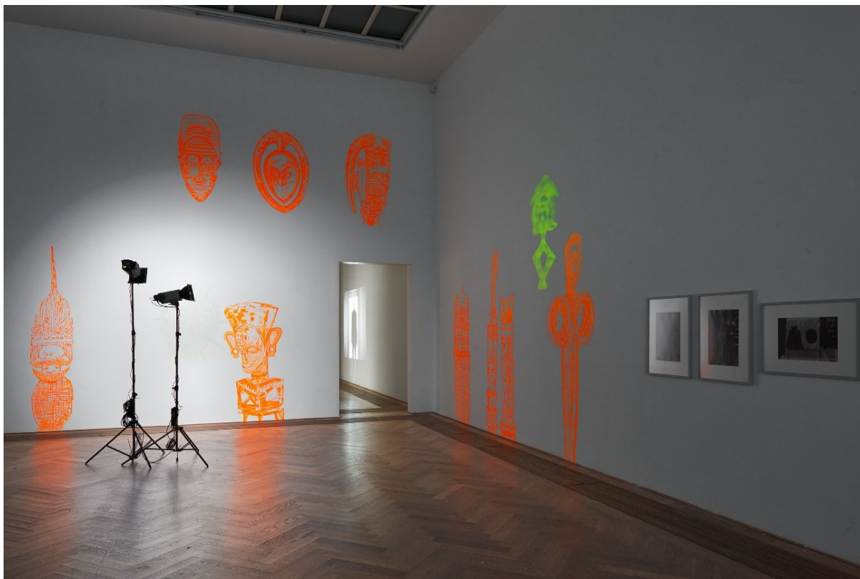
Cécile Hummel, Installationsansicht, Distant Glance , 2017, Exposed Exhibitions – Fotoarchiv der Kunsthalle Basel, Kunsthalle Basel, 2017.