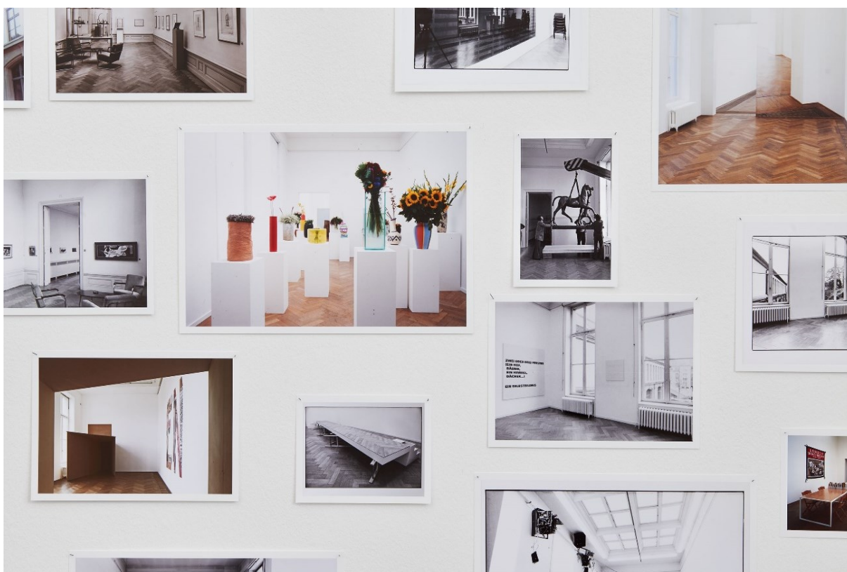
Detailansicht von ausgewähltem Archivmaterial „Raumarchäologie“, Exposed Exhibitions – Fotoarchiv der Kunsthalle Basel, Kunsthalle Basel, 2017.