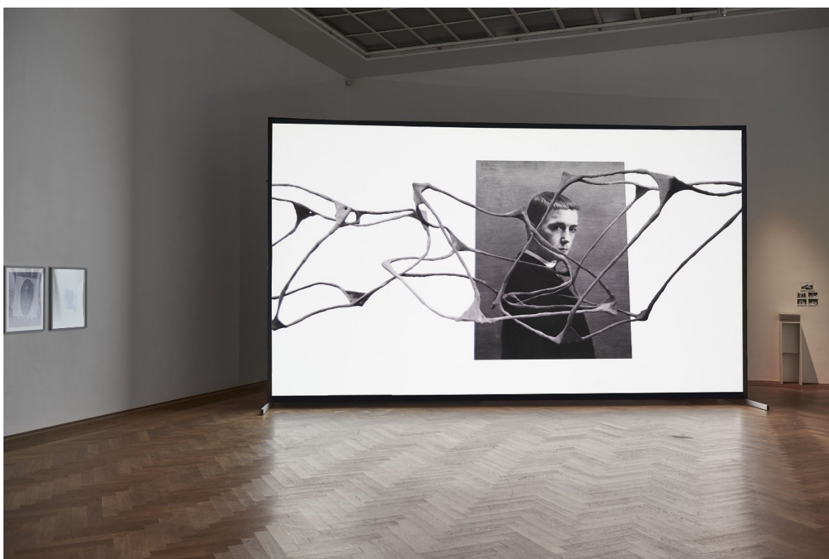
Esther Hunziker, Installationsansicht, Hall , 2017, Exposed Exhibitions – Fotoarchiv der Kunsthalle Basel, Kunsthalle Basel, 2017.