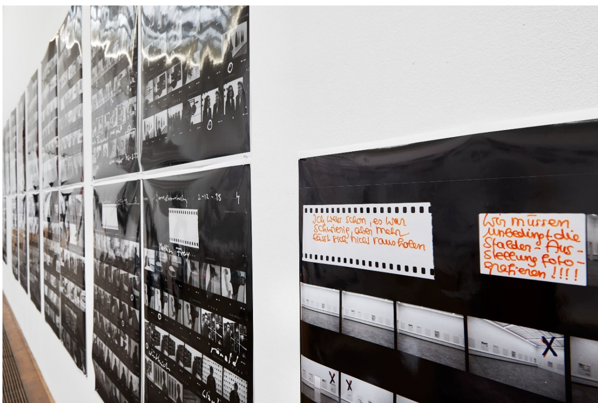
Detailansicht von ausgewähltem Archivmaterial „Kontaktabzüge“, Exposed Exhibitions – Fotoarchiv der Kunsthalle Basel , Kunsthalle Basel, 2017.

Installation view of selected archival material "Contact Sheets," Exposed Exhibitions – Fotoarchiv der Kunsthalle Basel , Kunsthalle Basel, 2017.