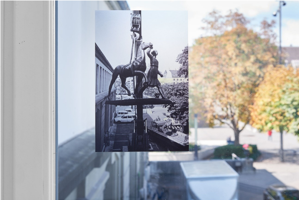
Detailansicht von ausgewähltem Archivmaterial „Raumarchäologie“, Exposed Exhibitions – Fotoarchiv der Kunsthalle Basel , Kunsthalle Basel, 2017.

Detail view of selected archival material "Archeology of Rooms," Exposed Exhibitions – Fotoarchiv der Kunsthalle