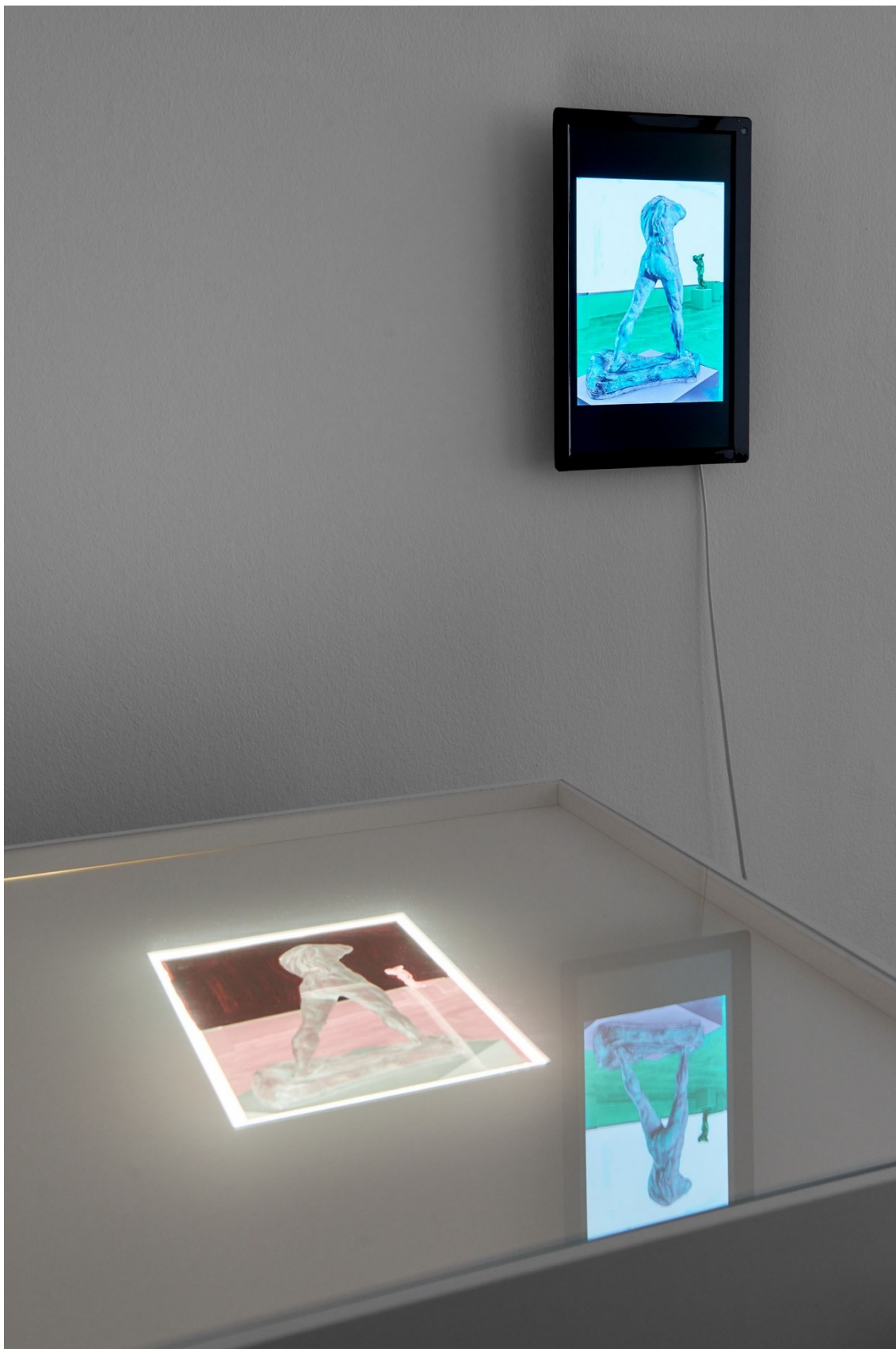
Detailansicht von ausgewähltem Archivmaterial „Bildveränderungen / Bildverlust“, Exposed Exhibitions – Fotoarchiv der Kunsthalle Basel , Kunsthalle Basel, 2017.

Detail view of selected archival material "Image Transformation / Image Loss," Exposed Exhibitions – Fotoarchiv der Kunsthalle Basel , Kunsthalle Basel, 2017.