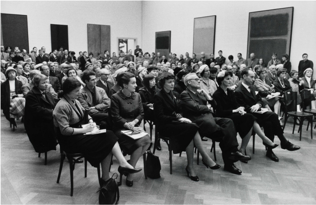
Eröffnung, Die neue amerikanische Malerei , Kunsthalle Basel, 1958.

Opening, Die neue amerikanische Malerei , Kunsthalle Basel, 1958.