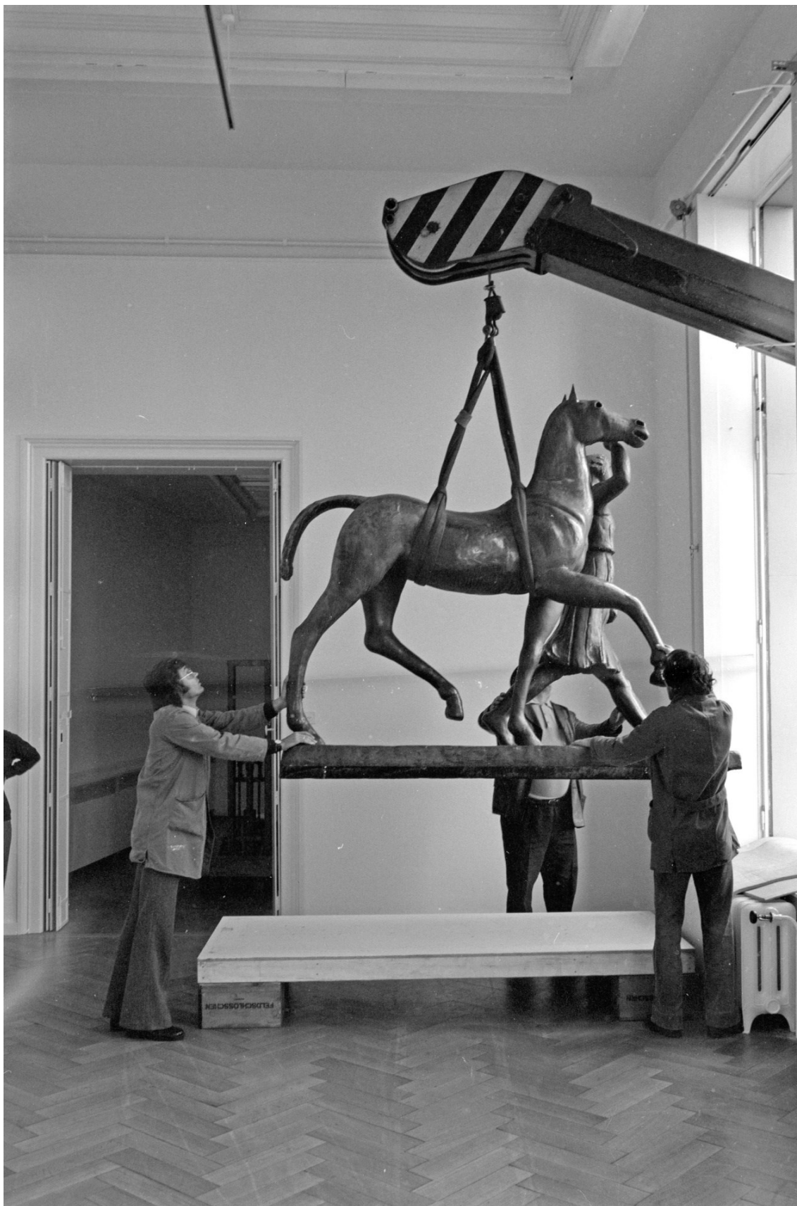
Ausstellungsaufbau, Carl Burckhardt , Kunsthalle Basel, 1978. Installation of the exhibition, Carl Burckhardt , Kunsthalle Basel, 1978.