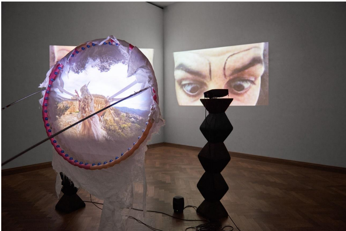
Raphaella Vogel, Installationsansicht, Ultranackt , Blick auf Fruit of the Hoop , 2018, Kunsthalle Basel, 2018.