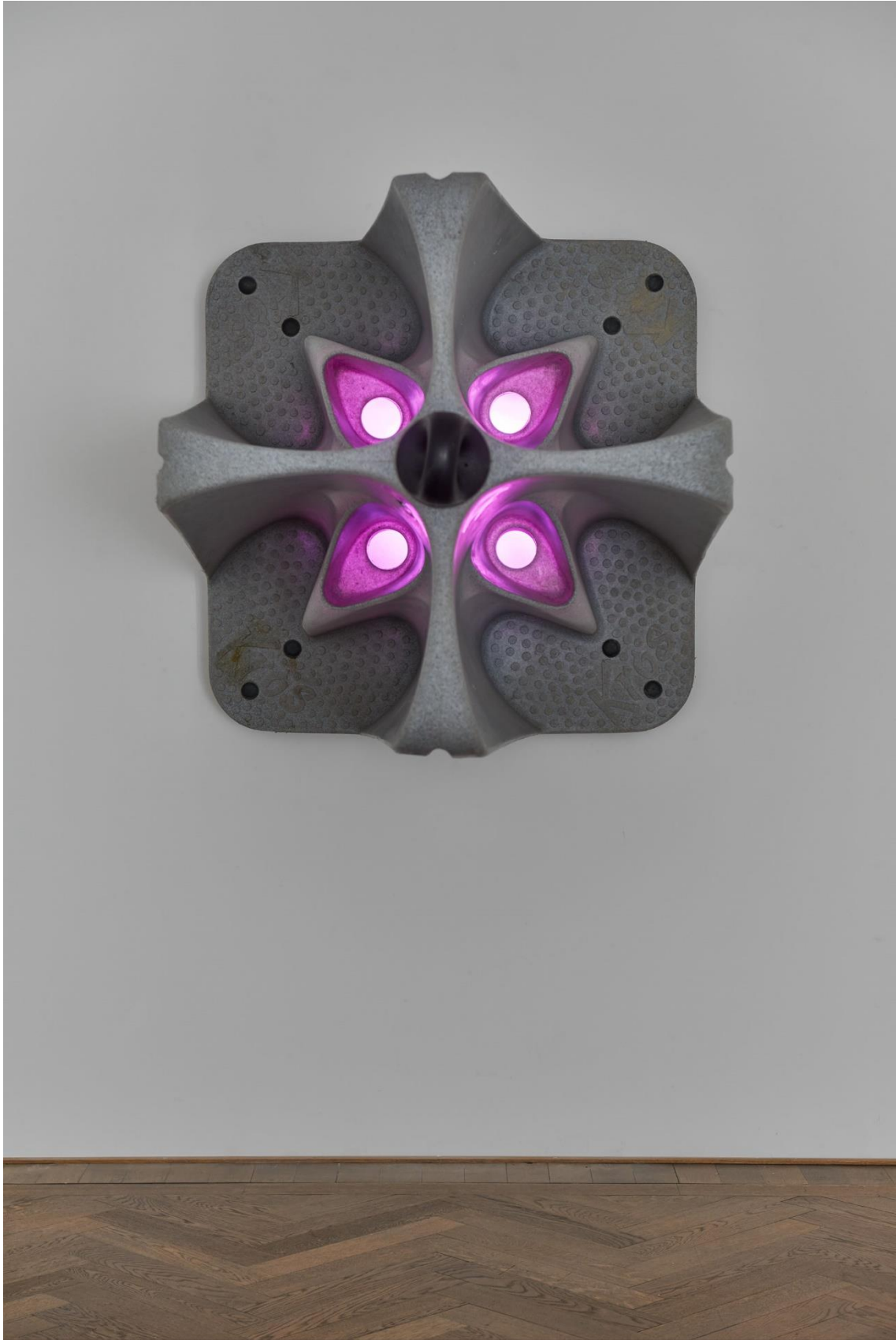
Raphaela Vogel, Installationsansicht, Ultranackt , Blick auf Uterusland , 2018, Kunsthalle Basel, 2018.