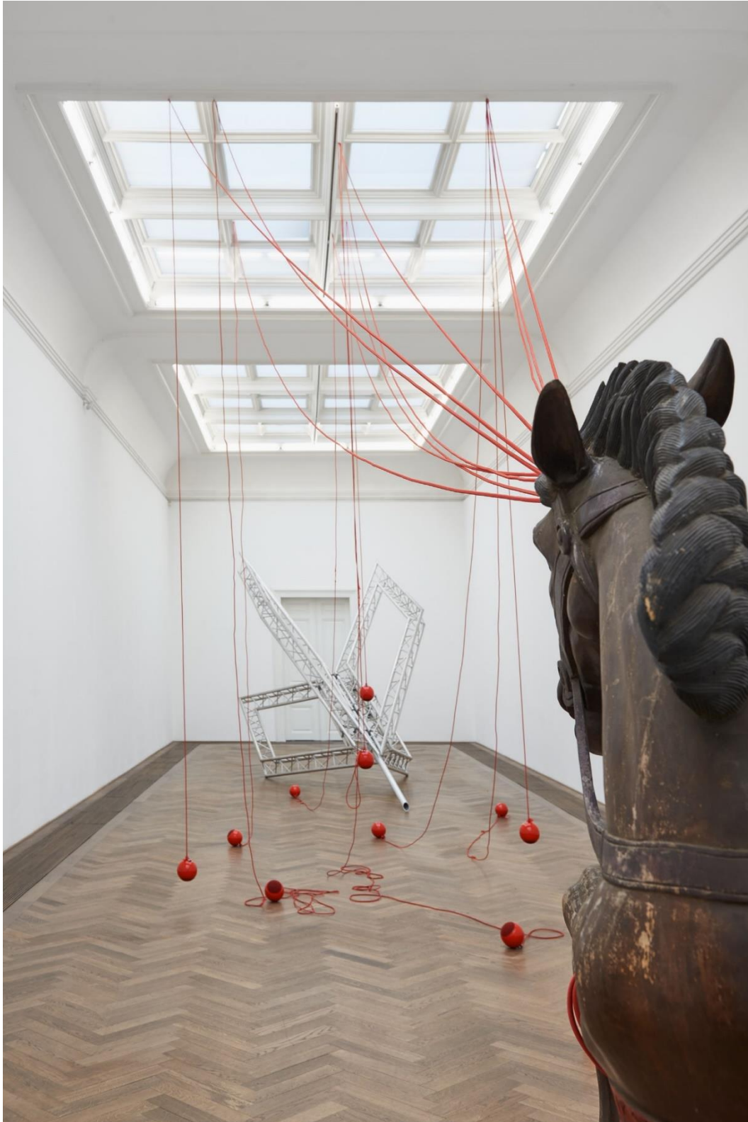
Raphaella Vogel, Installationsansicht, Ultranackt , Blick auf Kopfschuss , 2018, Kunsthalle Basel, 2018.