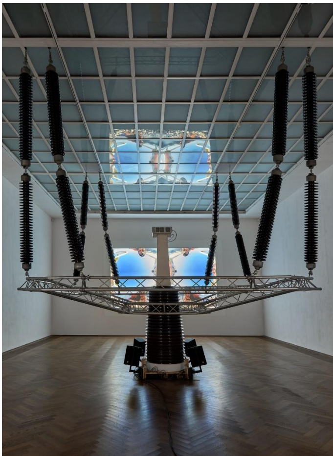
Raphaëla Vogel, Installationsansicht, Ultranaecht , Blick auf Isolator , 2016, Kunsthalle Basel, 2018. Raphaëla Vogel, Installation view, Ultranaecht , view on Isolator , 2016, Kunsthalle Basel, 2018.