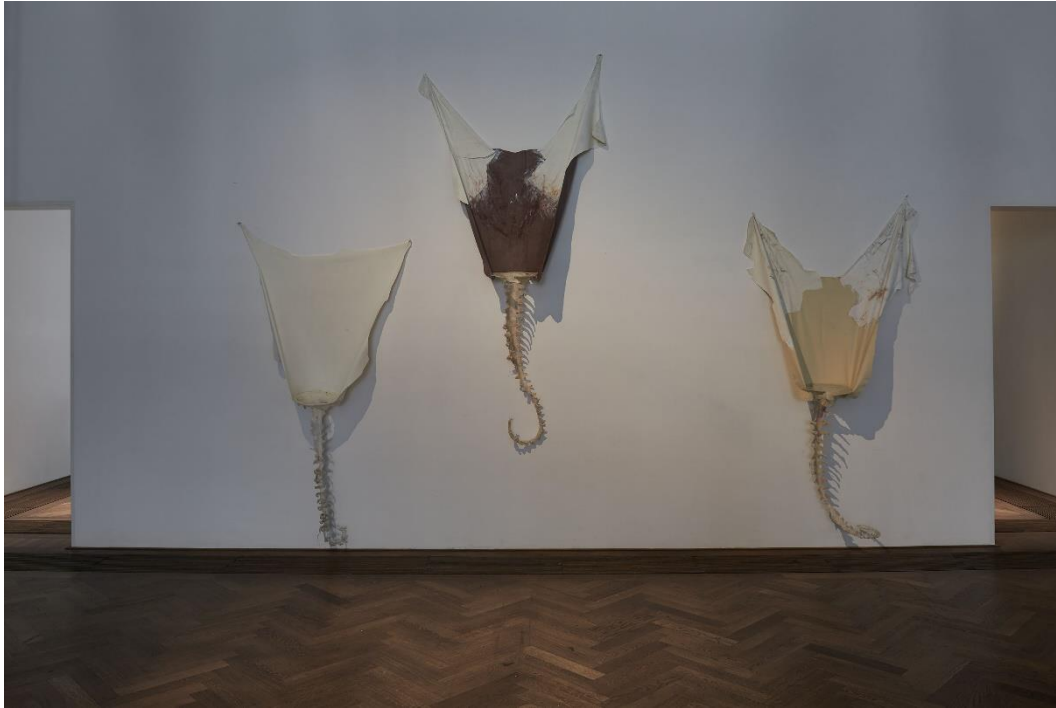
Raphaella Vogel, Installationsansicht, Ultranackt , Blick v.l.n.r. auf Heidi , Vreni und Alma , alle 2018, Kunsthalle Basel, 2018.

Raphaella Vogel, Installation view, Ultranackt , view f.l.t.r. on Heidi , Vreni , and Alma , all 2018, Kunsthalle Basel, 2018.