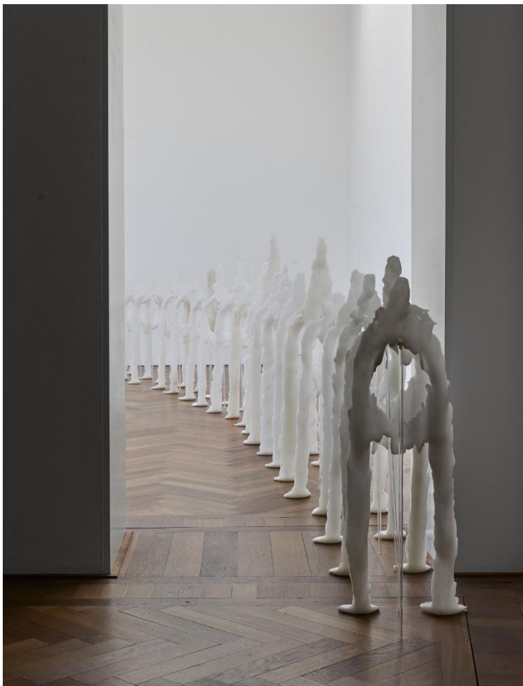
Raphaela Vogel, Installationsansicht, Ultranackt , Blick auf Uri , 2018, Kunsthalle Basel, 2018.