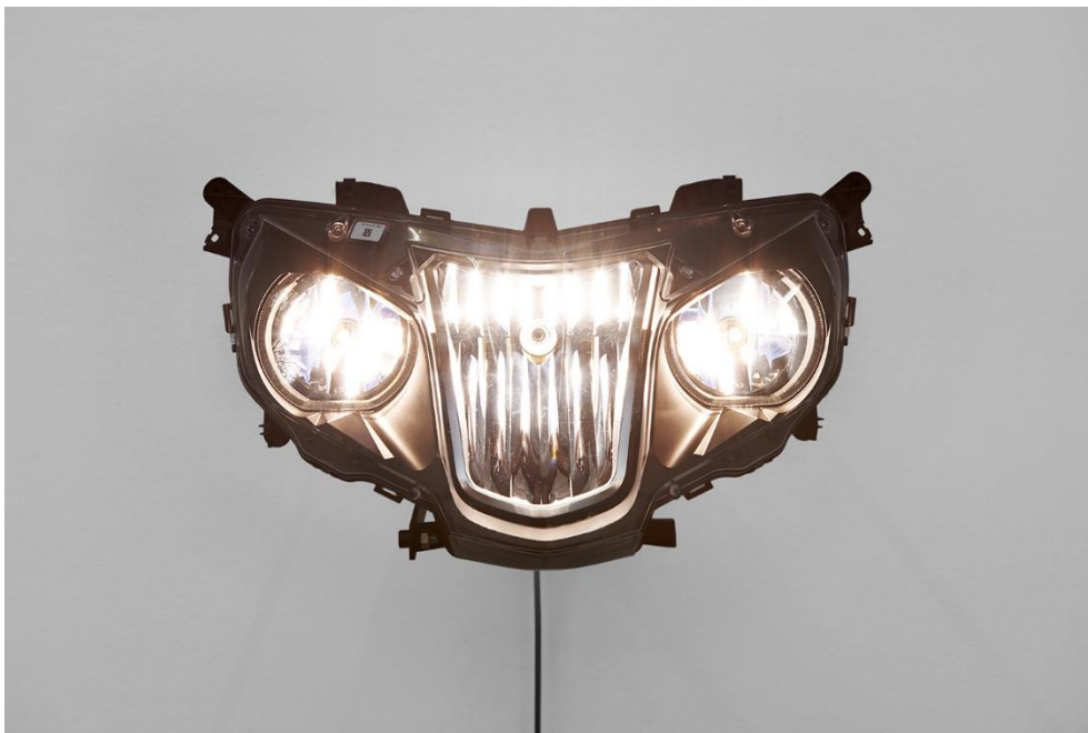
Yngve Holen, Hater Headlight , 2016. Foto: Philipp Hänger / Yngve Holen, Hater Headlight , 2016. Photo: Philipp Hänger