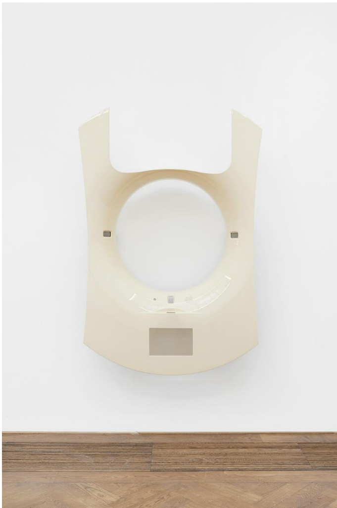
Yngve Holen, Taxi B-QK 9999 kommt innerhalb von 2 Minuten , 2016. Foto: Philipp Hänger / Yngve Holen, Taxi B-QK 9999 kommt innerhalb von 2 Minuten , 2016. Photo: Philipp Hänger

Alle Arbeiten, falls nicht anders angegeben, Courtesy Yngve Holen; Galerie Neu, Berlin; Modern Art, London; Neue Alte Brücke, Frankfurt/M.