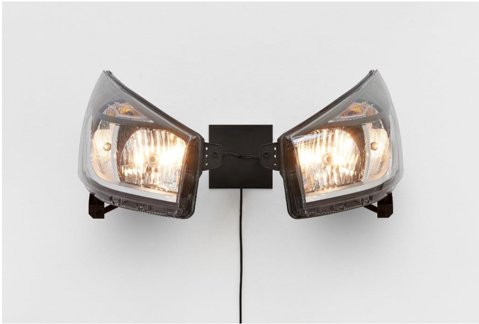
Yngve Holen, Hater Headlight , 2016. / Yngve Holen, Hater Headlight , 2016.