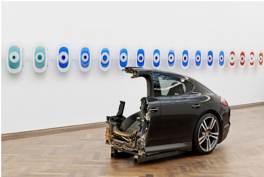
Yngve Holen, Installationsansicht VERTICALSEAT , Blick auf CAKE , 2016 und Window seat 10-21 A , 2016, Kunsthalle Basel, 2016. Foto: Philipp Hänger / Yngve Holen, Installation view VERTICALSEAT , view on CAKE , 2016 and Window seat 10-21 A , 2016, Kunsthalle Basel, 2016. Photo: Philipp Hänger