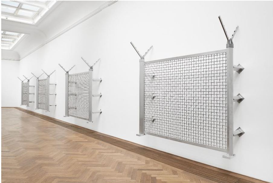
Yngve Holen, Installationsansicht VERTICALSEAT , Kunsthalle Basel, 2016. Yngve Holen, Installation view VERTICALSEAT , Kunsthalle Basel, 2016.