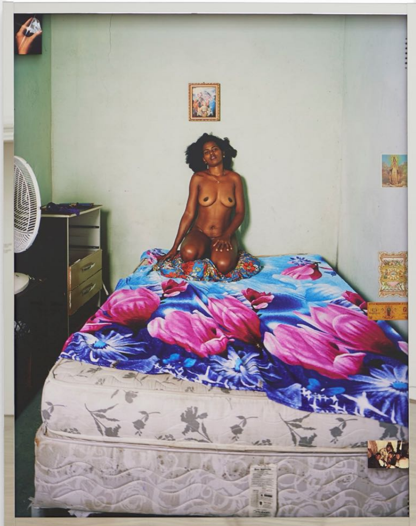
Deana Lawson, Installationsansicht, Centropy , Kunsthalle Basel, 2020, Blick auf House of My Deceased Lover , 2019.