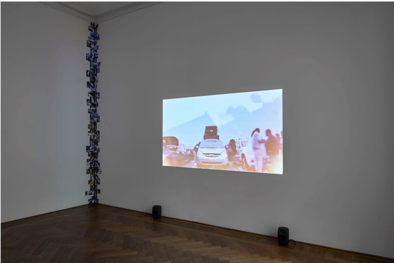
Deana Lawson, Installationsansicht, Centropy , Kunsthalle Basel, 2020, Detail von Waterfall Assemblage (Arbeitstitel), 2020 (links) und Blick auf Untitled (Arbeitstitel), 2018 (rechts).