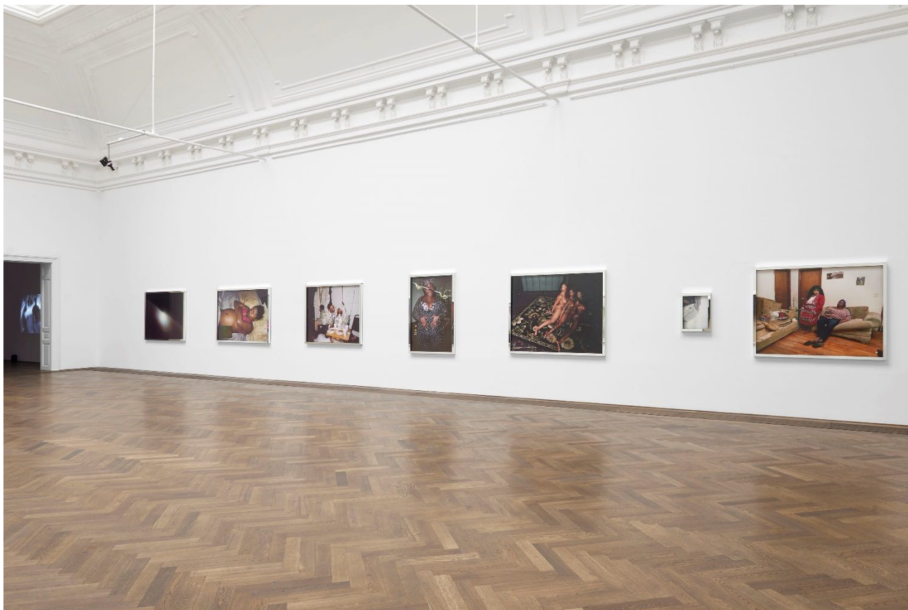
Deana Lawson, Installationsansicht, Centropy , Kunsthalle Basel, 2020. Deana Lawson, installation view, Centropy , Kunsthalle Basel, 2020.