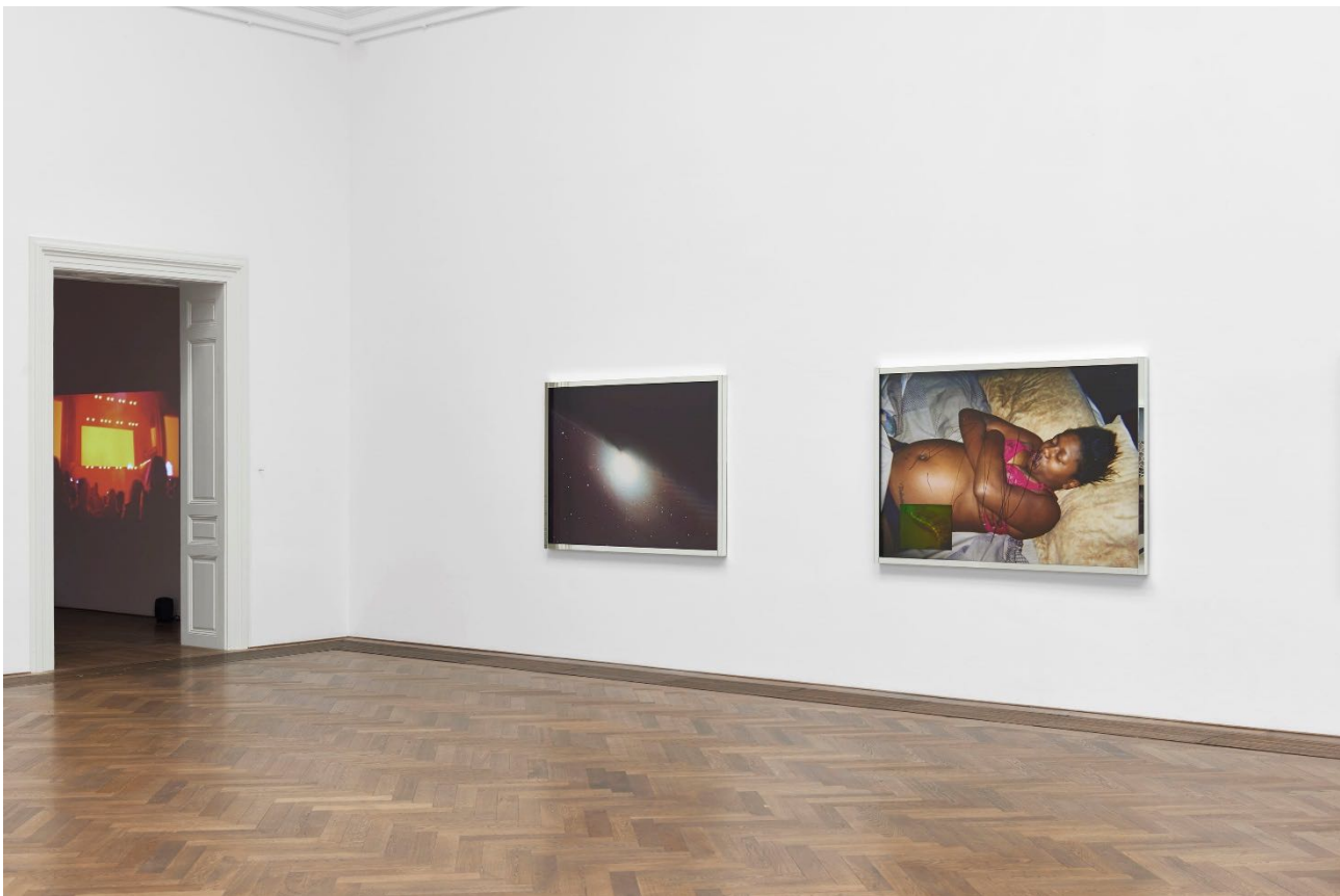
Deana Lawson, Installationsansicht, Centropy , Kunsthalle Basel, 2020, Blick auf Black Horizons , 2020 (links) und Deleon? Unknown , 2020 (rechts). Deana Lawson, installation view, Centropy , Kunsthalle Basel, 2020, view on Black Horizons , 2020 (left) and Deleon? Unknown , 2020 (right).