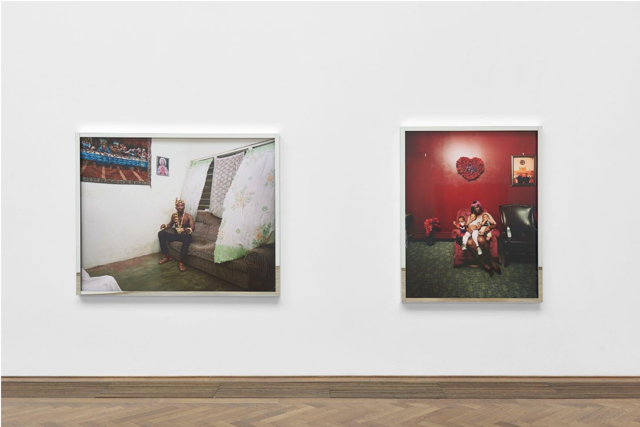
Deana Lawson, Installationsansicht, Centropy , Kunsthalle Basel, 2020, Blick auf Chief , 2019 (links) und Young Grandmother , 2019 (rechts).