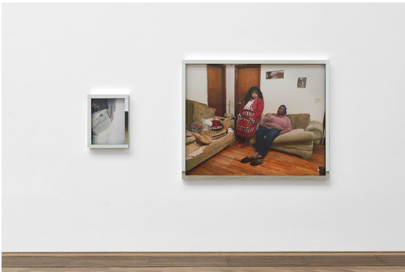
Deana Lawson, Installationsansicht, Centropy , Kunsthalle Basel, 2020, Blick auf Niagara Falls , 2018 (links) und Taneisha's Gravity , 2019 (rechts). Deana Lawson, installation view, Centropy , Kunsthalle Basel, 2020, view on Niagara Falls , 2018 (left) and Taneisha's Gravity , 2019 (right).