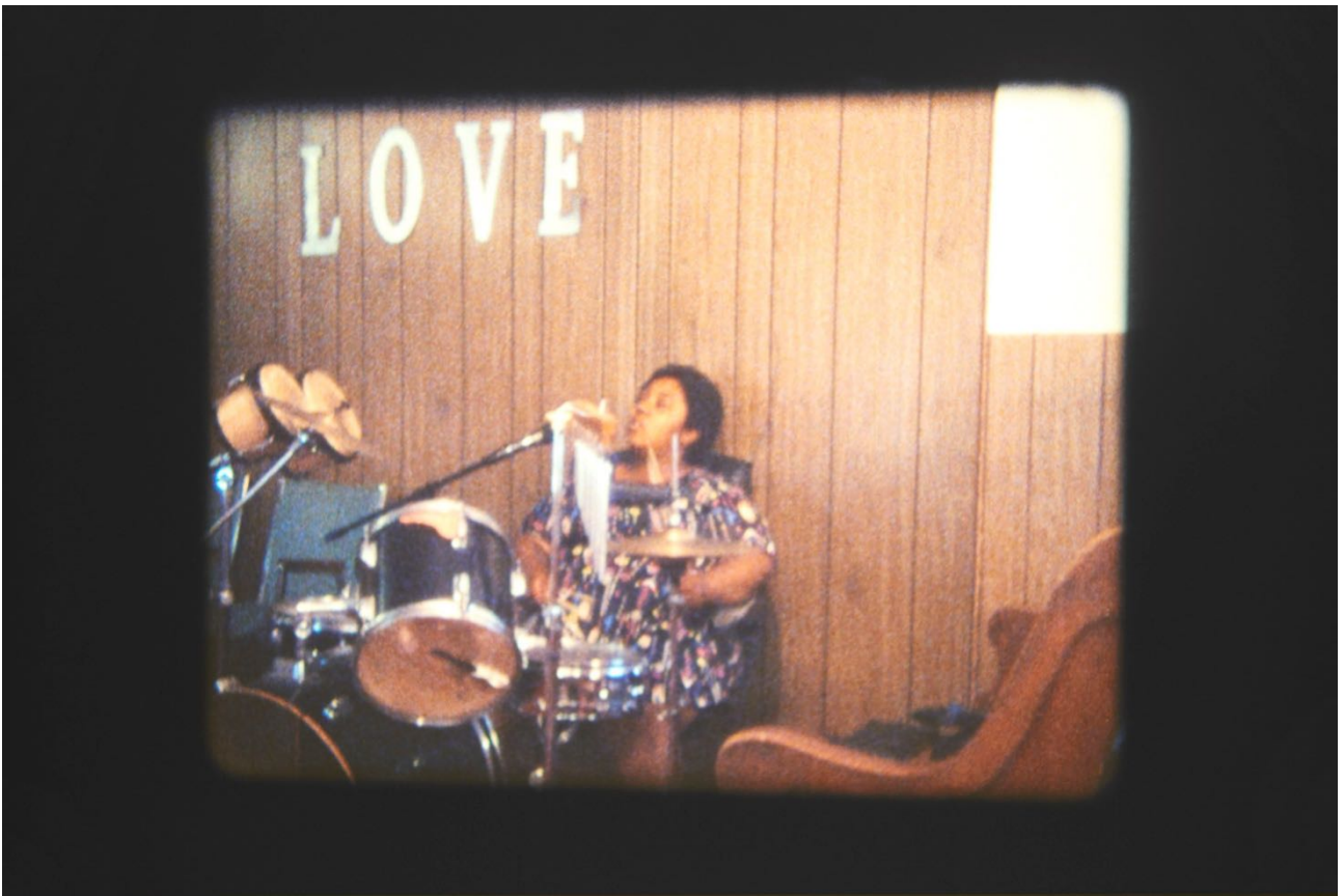
Deana Lawson, Installationsansicht, Centropy , Kunsthalle Basel, 2020, Blick auf Fragment (church) (Arbeitstitel), 2020.