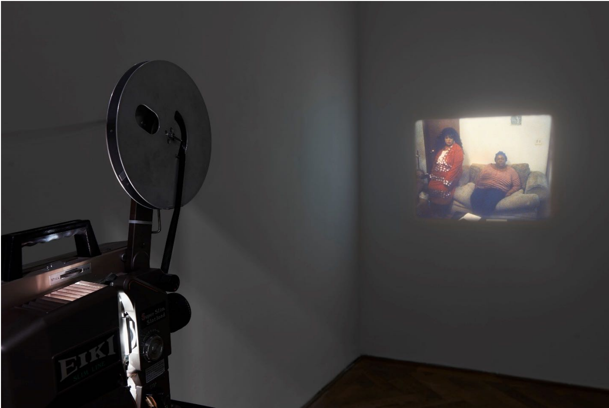
Deana Lawson, Installationsansicht, Centropy , Kunsthalle Basel, 2020, Blick auf Fragment (Jacqueline and Taneisha) (Arbeitstitel), 2020.