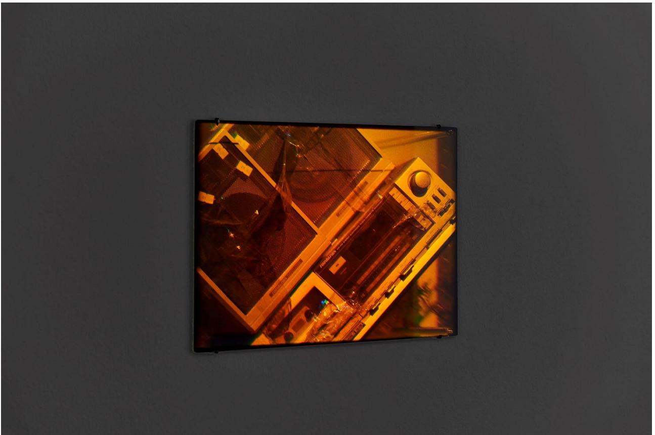
Deana Lawson, Installationsansicht, Centropy , Kunsthalle Basel, 2020, Blick auf Boom Box Hologram (Arbeitstitel), 2020.