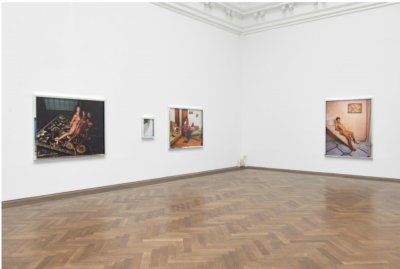
Deana Lawson, Installationsansicht, Centropy , Kunsthalle Basel, 2020. Deana Lawson, installation view, Centropy , Kunsthalle Basel, 2020.