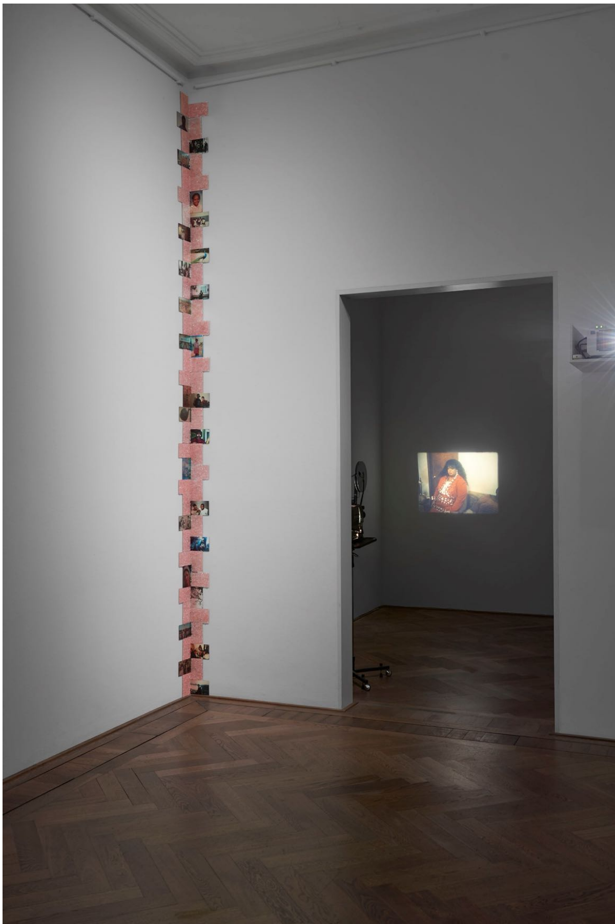
Deana Lawson, Installationsansicht, Centropy , Kunsthalle Basel, 2020, Detail von Crystal Assemblage (Arbeitstitel), 2020 (links) und Blick auf Fragment (Jacqueline and Taneisha) (Arbeitstitel), 2020 (rechts).