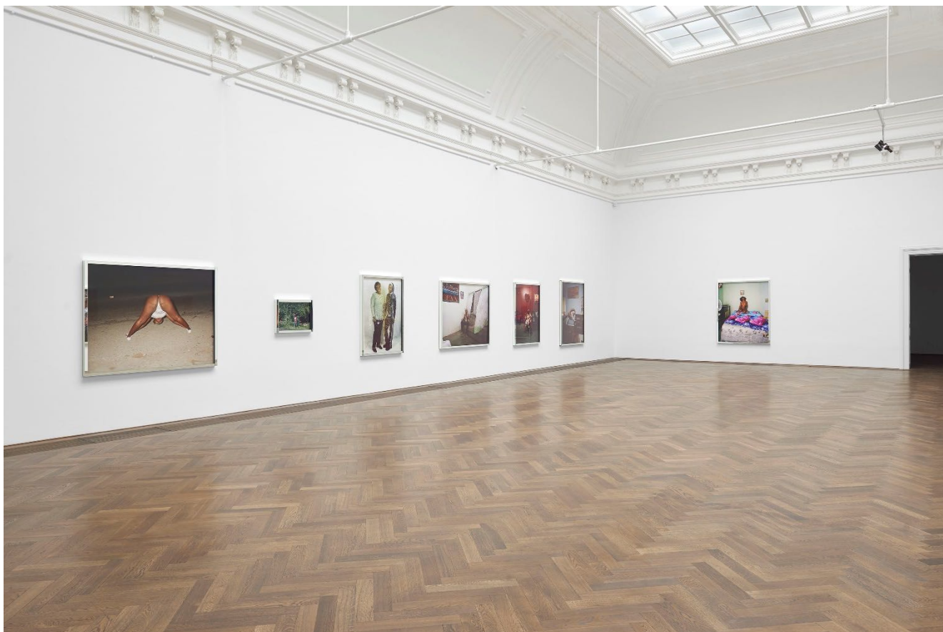
Deana Lawson, Installationsansicht, Centropy , Kunsthalle Basel, 2020.