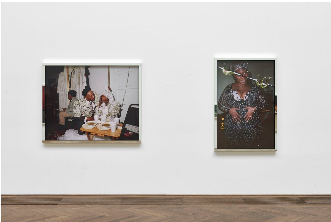
Deana Lawson, Installationsansicht, Centropy , Kunsthalle Basel, 2020, Blick auf Latifah's Wedding , 2020 (links) und Vera , 2020 (rechts). Deana Lawson, installation view, Centropy , Kunsthalle Basel, 2020, view on Latifah's Wedding , 2020 (left) and Vera , 2020 (right).