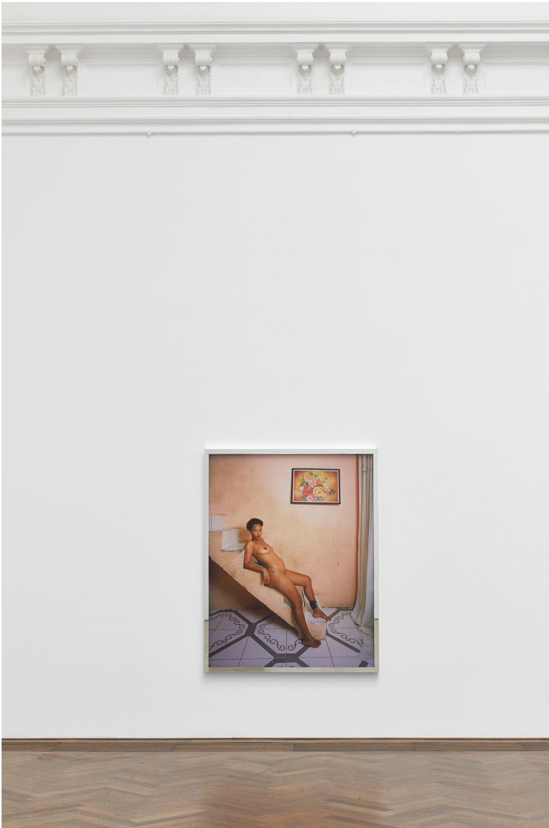
Deana Lawson, Installationsansicht, Centropy , Kunsthalle Basel, 2020, Blick auf Daenare , 2019. Deana Lawson, installation view, Centropy , Kunsthalle Basel, 2020, view on Daenare , 2019.

Pressebilder / Press Images Download-Link: kunsthallebasel.ch/presse/