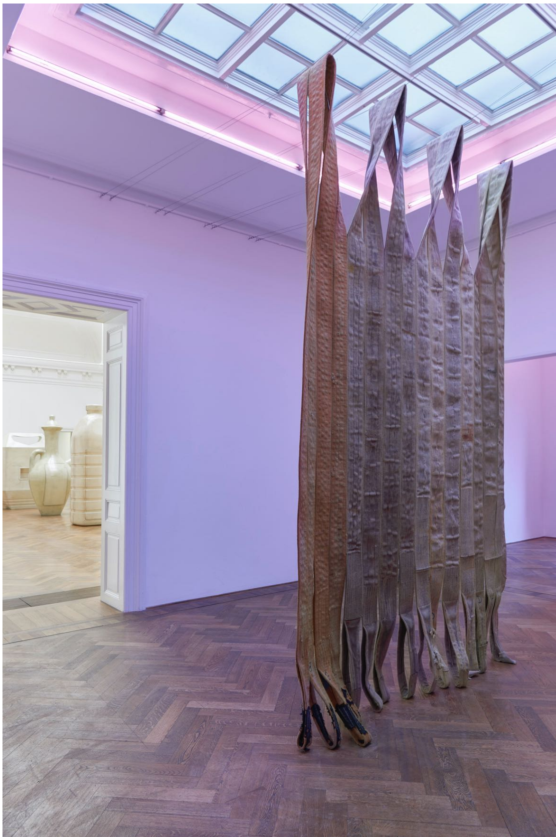
Installationsansicht, Alia Farid, In Lieu of What Is, Blick auf Pipeline sling tapestry , 2022, Kunsthalle Basel, 2022.