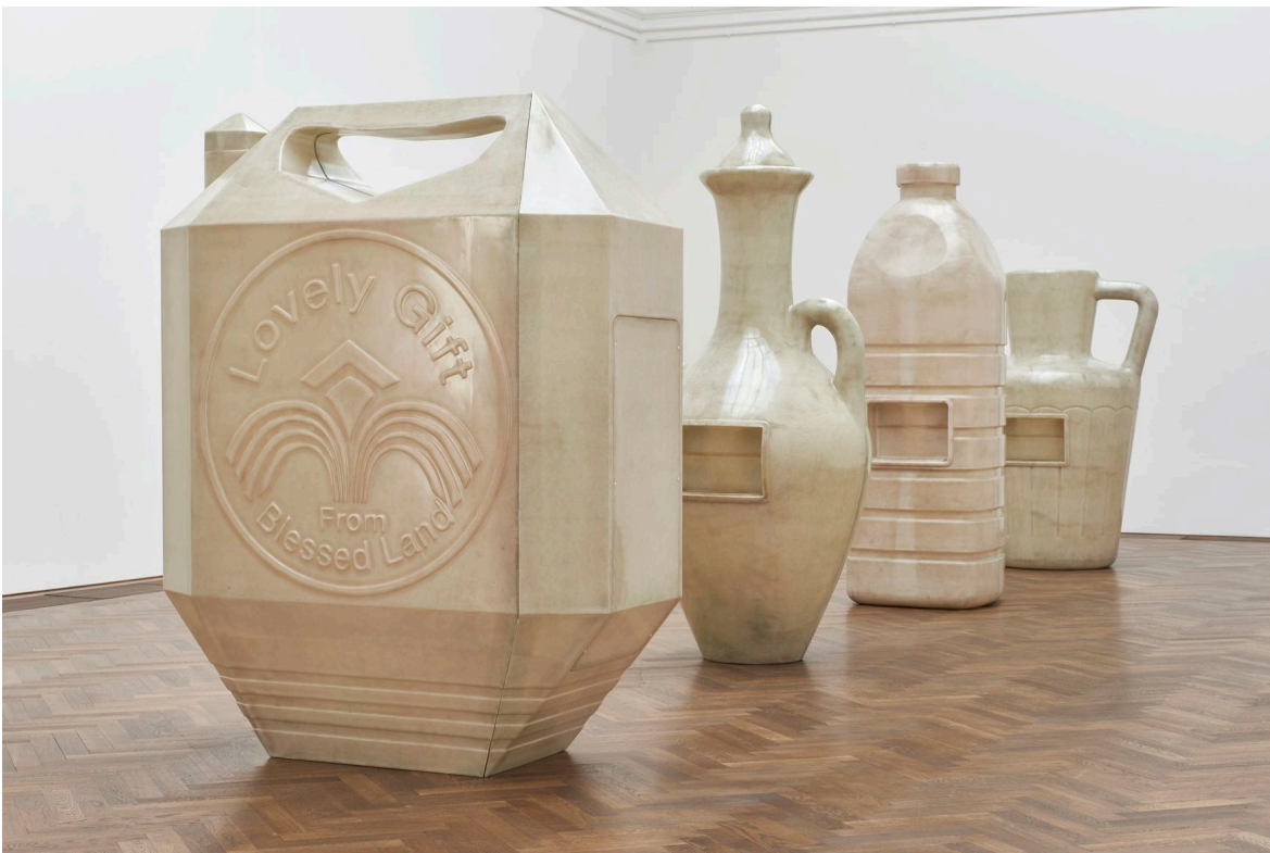
Installationsansicht, Alia Farid, In Lieu of What Is , Kunsthalle Basel, 2022. Foto: Philipp Hänger / Kunsthalle Basel Installation view, Alia Farid, In Lieu of What Is , Kunsthalle Basel, 2022. Photo: Philipp Hänger / Kunsthalle Basel

Installation view, Alia Farid, In Lieu of What Is , view f. l. t. r. on Jug/Pitcher , Water Bottle , Juglet , Jerrican , Lota , all 2022, Kunsthalle Basel, 2022. Photo: Philipp Hänger / Kunsthalle Basel