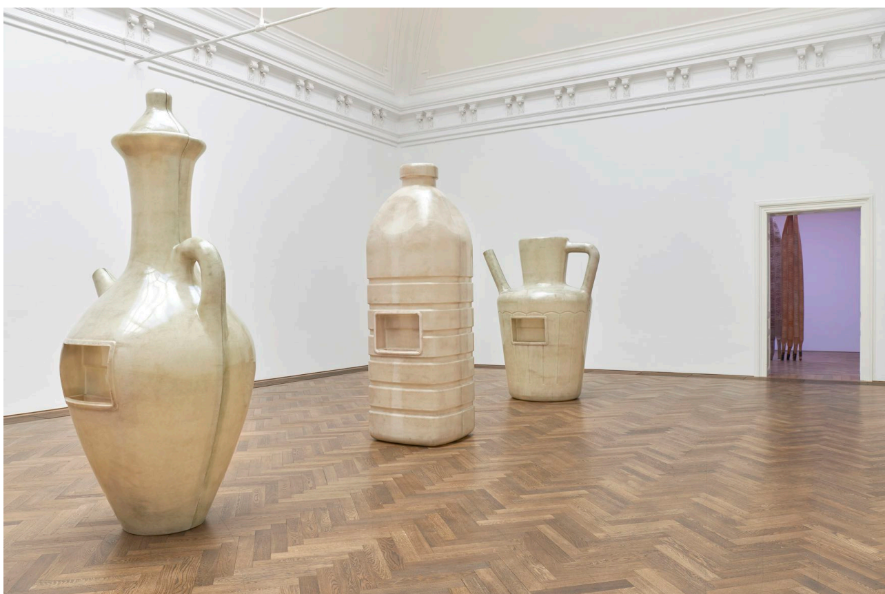
Installationsansicht, Alia Farid, In Lieu of What Is , Blick v. l. n. r. auf Juglet, Water Bottle, Jug/Pitcher, alle 2022, Kunsthalle Basel, 2022.

Installation view, Alia Farid, In Lieu of What Is , view f. l. t. r. on Lota, Jerrican, Juglet, Water Bottle, Jug/Pitcher, all 2022, Kunsthalle Basel, 2022.