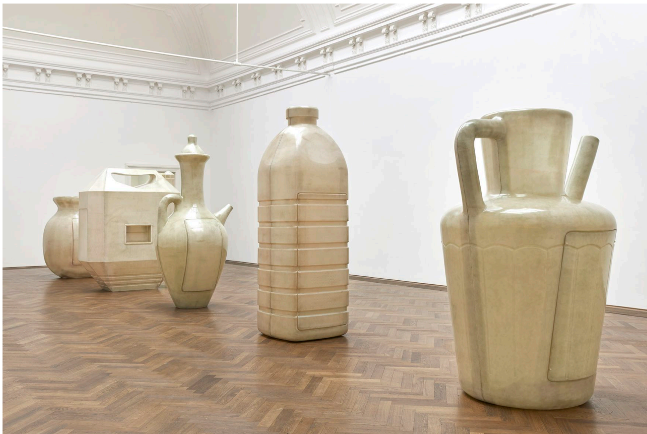
Installationsansicht, Alia Farid, In Lieu of What Is , Blick v. l. n. r. auf Lota, Jerrican, Juglet, Water Bottle, Jug/Pitcher, alle 2022, Kunsthalle Basel, 2022.

Installation view, Alia Farid, In Lieu of What Is , view f. l. t. r. on Lota, Jerrican, Juglet, Water Bottle, Jug/Pitcher, all 2022, Kunsthalle Basel, 2022.