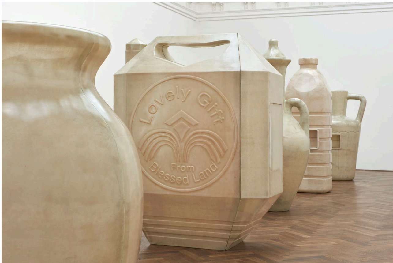
Installationsansicht, Alia Farid, In Lieu of What Is , Kunsthalle Basel, 2022. Installation view, Alia Farid, In Lieu of What Is , Kunsthalle Basel, 2022.