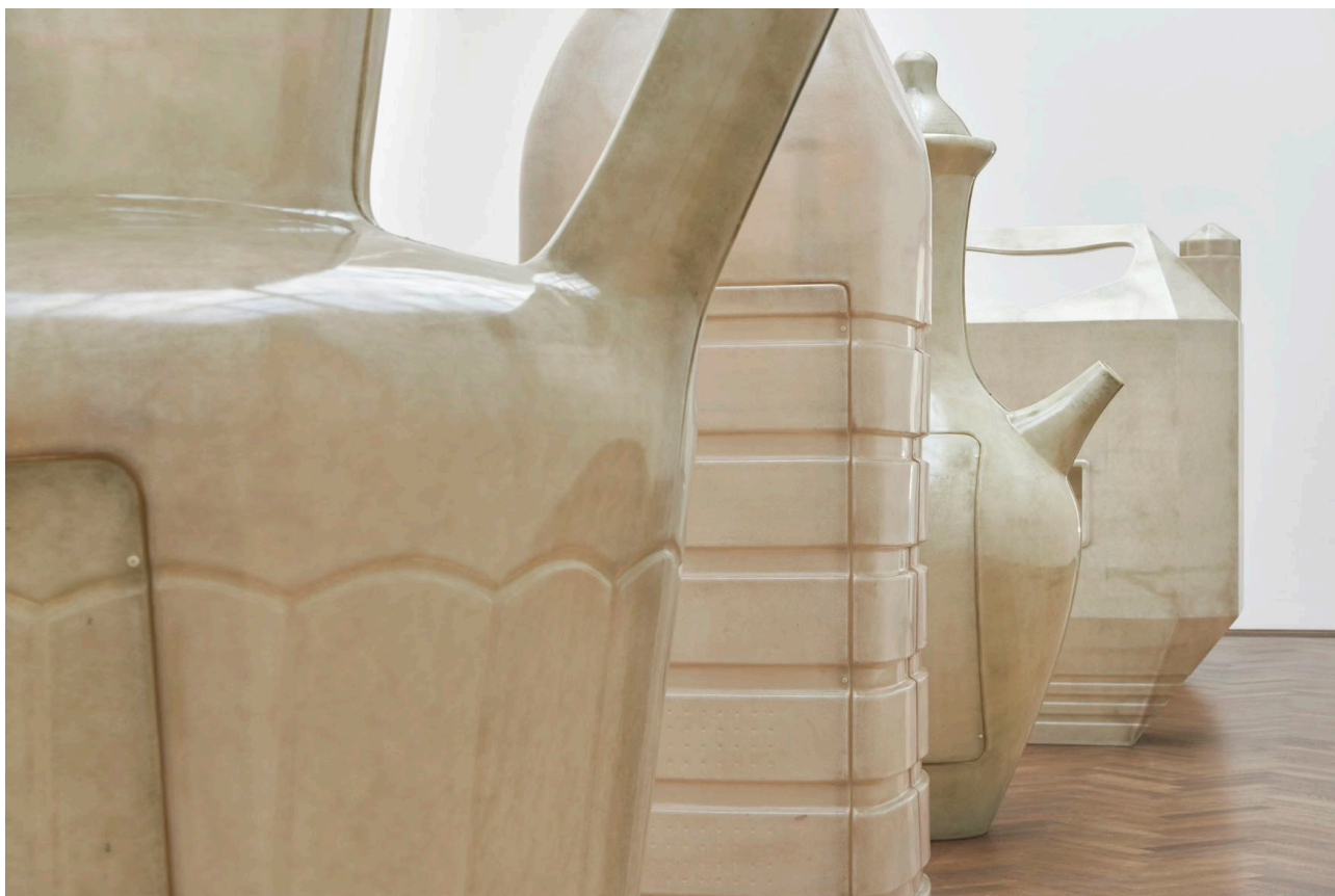
Installationsansicht, Alia Farid, In Lieu of What Is , Kunsthalle Basel, 2022. Installation view, Alia Farid, In Lieu of What Is , Kunsthalle Basel, 2022.