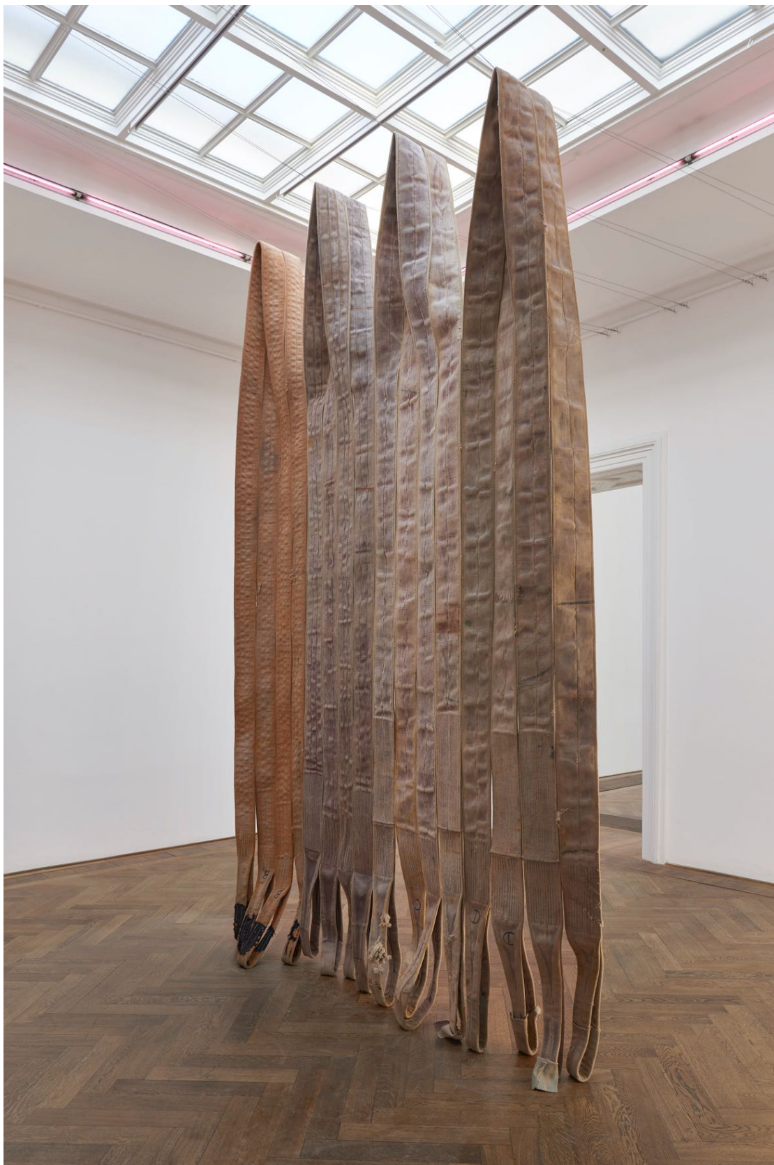
Installationsansicht, Alia Farid, In Lieu of What Is , Blick auf Pipeline sling tapestry , 2022, Kunsthalle Basel, 2022.