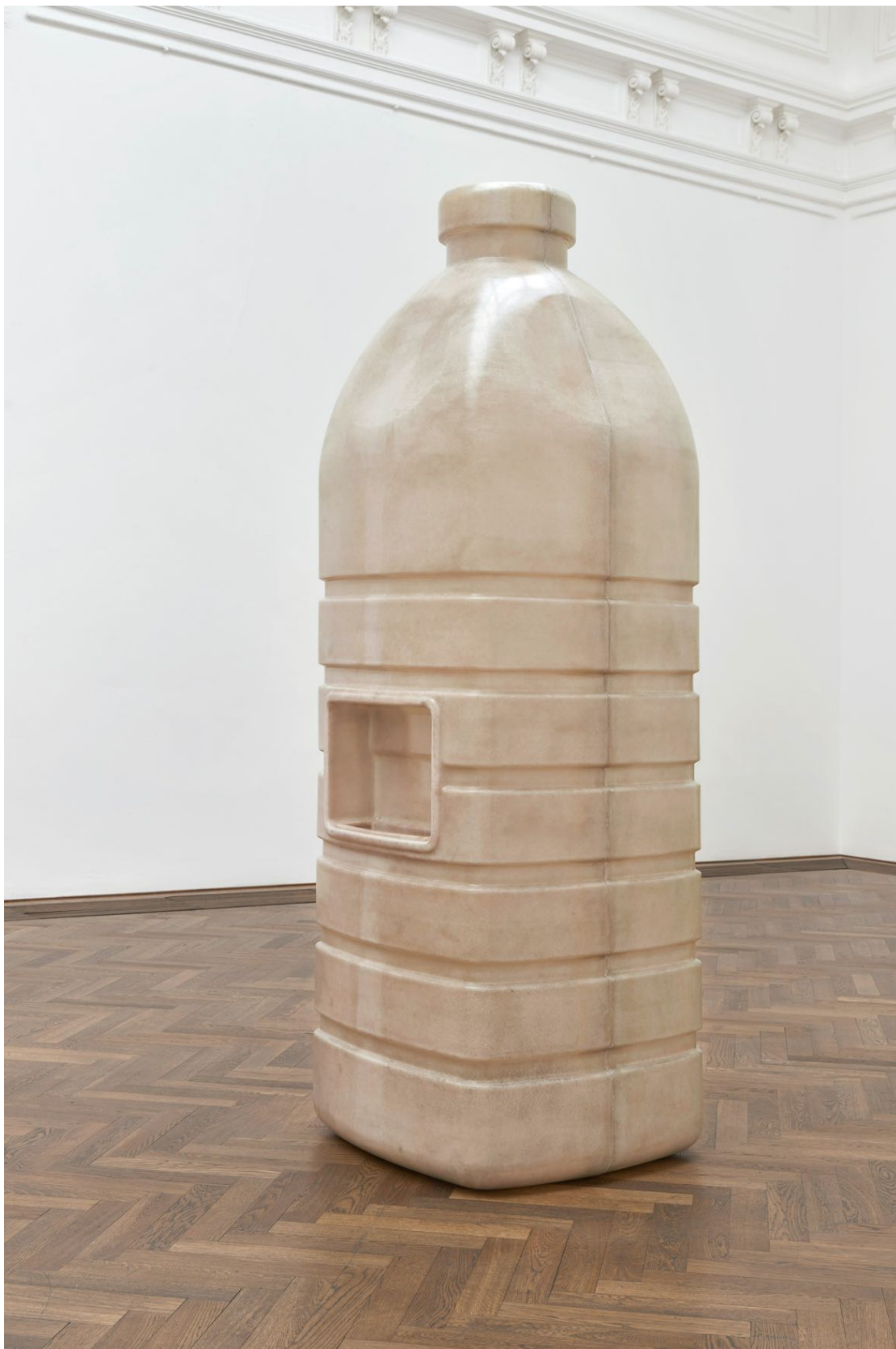
Installationsansicht, Alia Farid, In Lieu of What Is, Blick auf Water Bottle , 2022, Kunsthalle Basel, 2022. Installation view, Alia Farid, In Lieu of What Is, view on Water Bottle , 2022, Kunsthalle Basel, 2022.