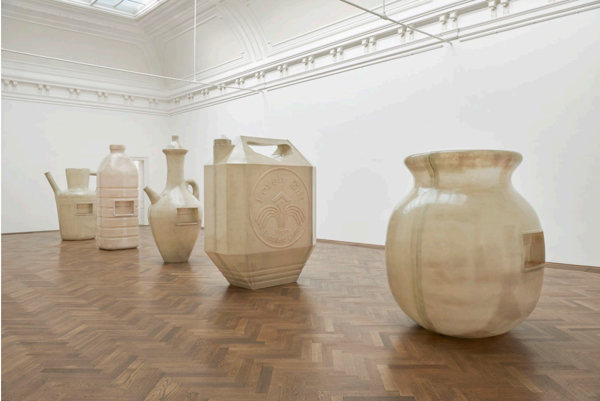
Installationsansicht, Alia Farid, In Lieu of What Is , Blick v. l. n. r. auf Jug/Pitcher , Water Bottle , Juglet , Jerrican , Lota , alle 2022, Kunsthalle Basel, 2022.

Pressebilder / Press Images Download-Link: kunsthallebasel.ch/presse/