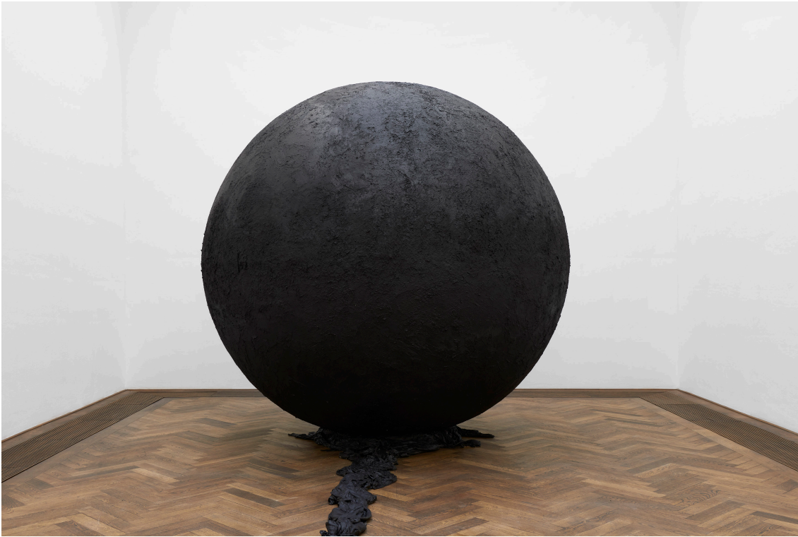
Installationsansicht, Pedro Wirz, Environmental Hangover , Kunsthalle Basel, 2022, Blick auf Exúvia , 2022. Installation view, Pedro Wirz, Environmental Hangover , Kunsthalle Basel, 2022, view on Exúvia , 2022.