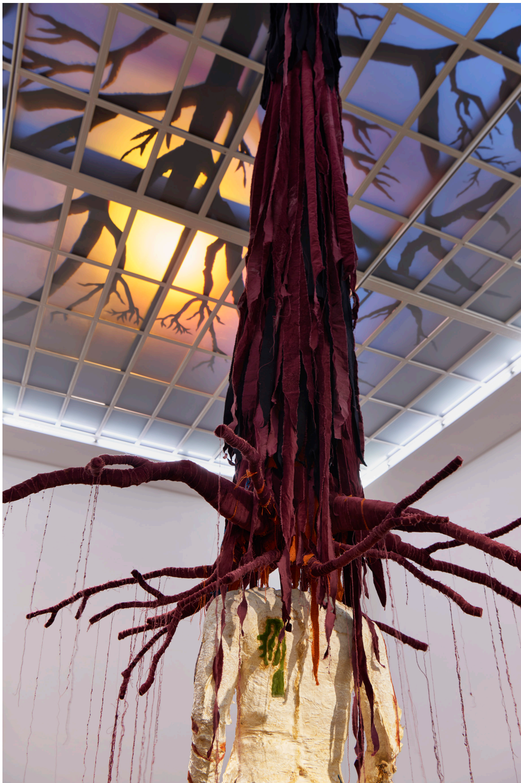
Installationsansicht, Pedro Wirz, Environmental Hangover , Kunsthalle Basel, 2022, Blick auf Chapéu Telúrico , 2022. Installation view, Pedro Wirz, Environmental Hangover , Kunsthalle Basel, 2022, view on Chapéu Telúrico , 2022.

Pressebilder / Press Images Download-Link: kunsthallebasel.ch/presse/