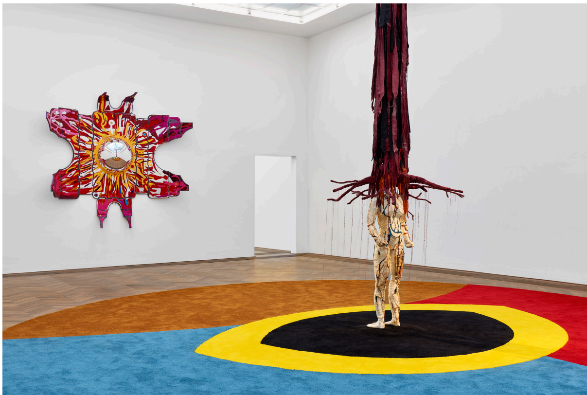
Installationsansicht, Pedro Wirz, Environmental Hangover , Kunsthalle Basel, 2022, Blick auf Flor Satélite , 2022 (links), Chapéu Telúrico , 2022 (rechts), Ovo Espacial , 2022 (Boden). Installation view, Pedro Wirz, Environmental Hangover , Kunsthalle Basel, 2022, view on Flor Satélite , 2022 (left), Chapéu Telúrico , 2022 (right), Ovo Espacial , 2022 (floor).