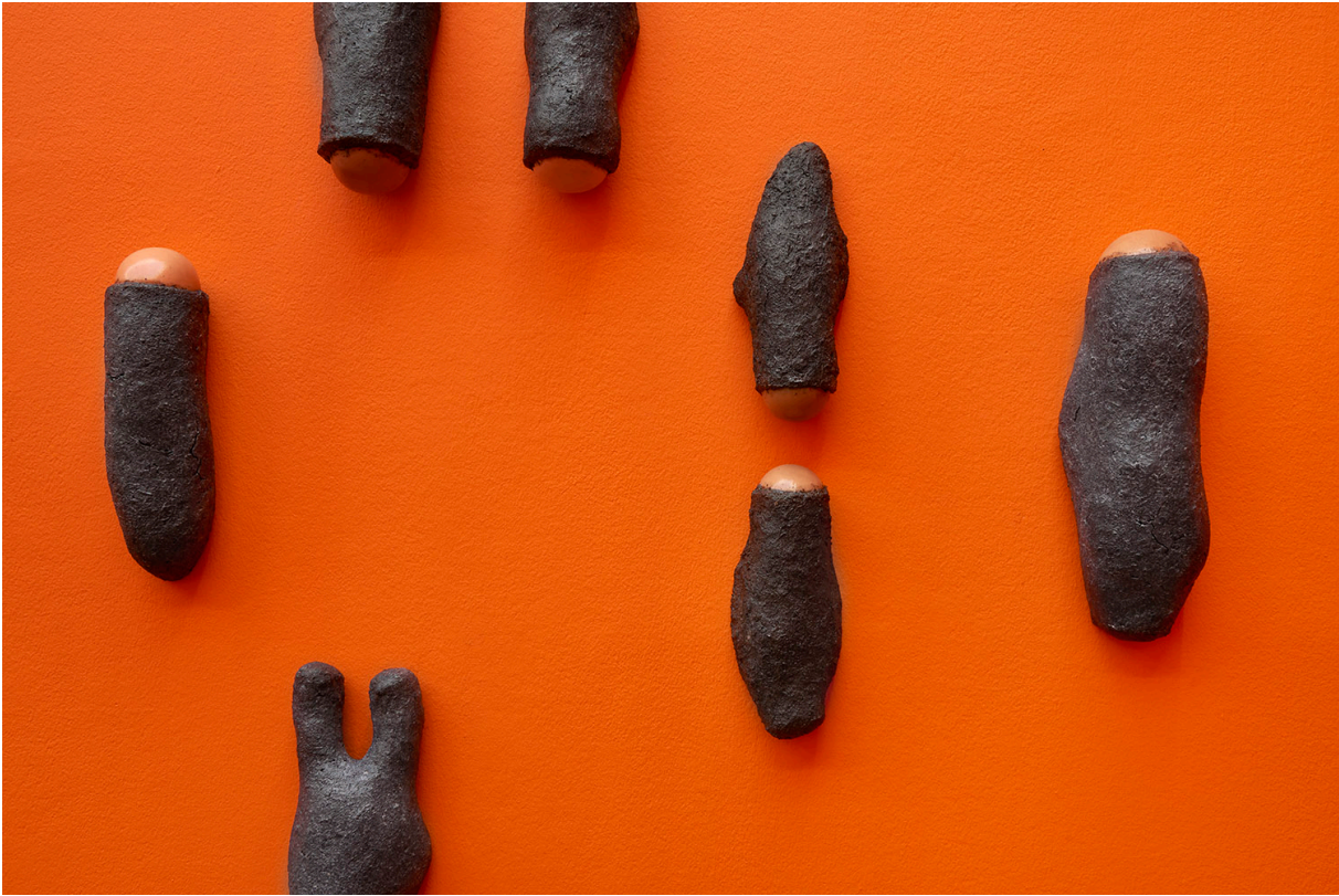
Installationsansicht, Pedro Wirz, Environmental Hangover , Kunsthalle Basel, 2022, Blick auf die Serie Sour Ground , 2022. Installation view, Pedro Wirz, Environmental Hangover , Kunsthalle Basel, 2022, view on the series Sour Ground , 2022.