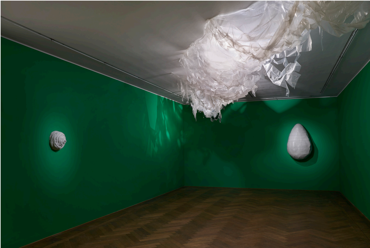
Installationsansicht, Pedro Wirz, Environmental Hangover , Kunsthalle Basel, 2022, Blick auf Untitled (Nest) , 2022 (links), Bela Peça , 2022 (rechts), Corpo Seco , 2022 (Decke). Installation view, Pedro Wirz, Environmental Hangover , Kunsthalle Basel, 2022, view on Untitled (Nest) , 2022 (left), Bela Peça , 2022 (right), Corpo Seco , 2022 (ceiling).