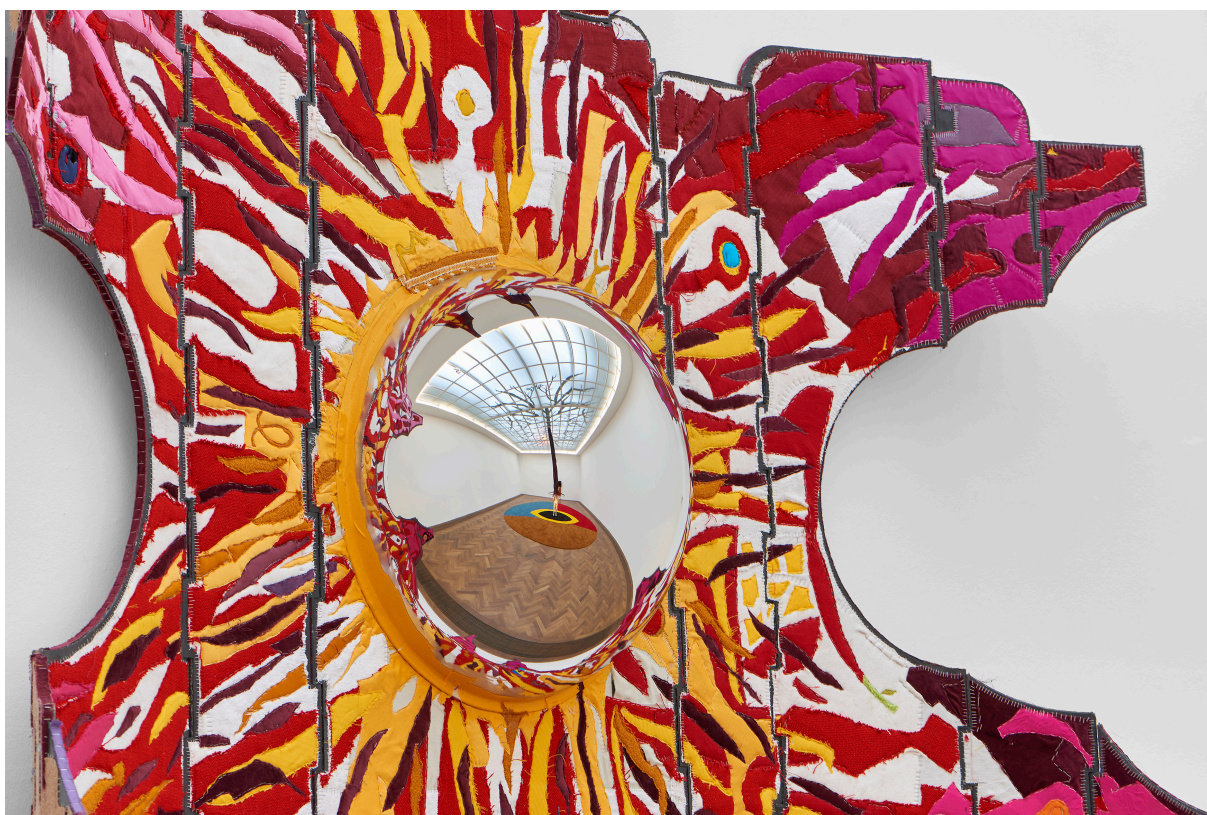
Installationsansicht, Pedro Wirz, Environmental Hangover , Kunsthalle Basel, 2022, Blick auf Flor Satélite , 2022. Installation view, Pedro Wirz, Environmental Hangover , Kunsthalle Basel, 2022, view on Flor Satélite , 2022.