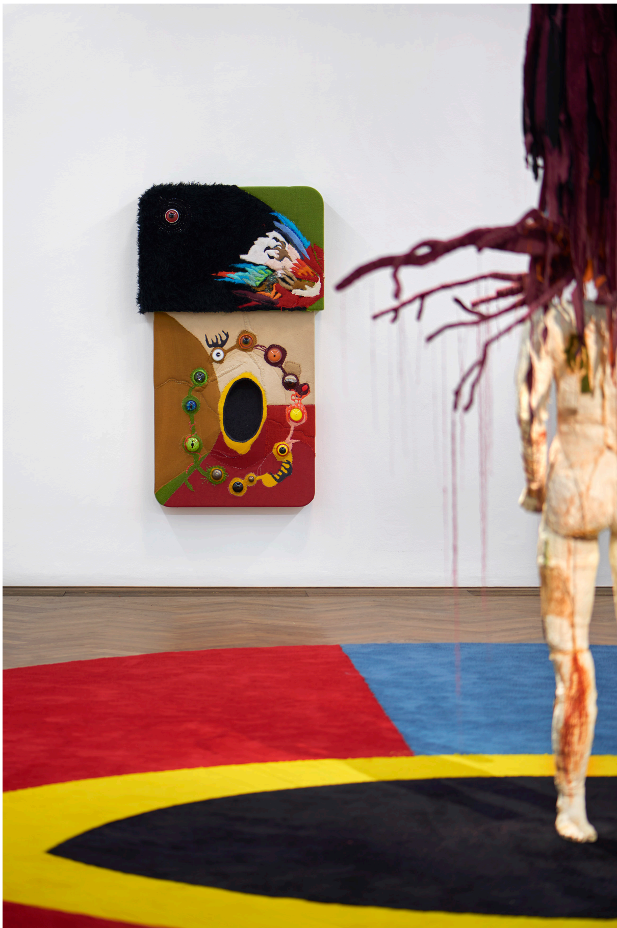
Installationsansicht, Pedro Wirz, Environmental Hangover , Kunsthalle Basel, 2022, Blick auf Coro de Princesa (Amarelão) , 2022 (links), Chapéu Telúrico , 2022 (rechts), Ovo Espacial , 2022 (Boden).