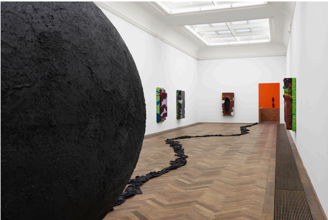
Installationsansicht, Pedro Wirz, Environmental Hangover , Kunsthalle Basel, 2022. Installation view, Pedro Wirz, Environmental Hangover , Kunsthalle Basel, 2022.