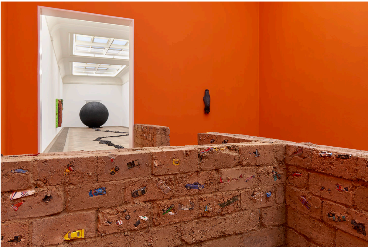
Installationsansicht, Pedro Wirz, Environmental Hangover , Kunsthalle Basel, 2022. Installation view, Pedro Wirz, Environmental Hangover , Kunsthalle Basel, 2022.