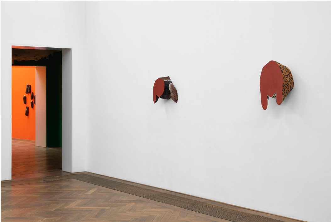
Installationsansicht, Pedro Wirz, Environmental Hangover , Kunsthalle Basel, 2022, Blick auf Bicho Abstrato (Tamanduá) , 2022 (links), und Bicho Abstrato (Onça) , 2022 (rechts). Installation view, Pedro Wirz, Environmental Hangover , Kunsthalle Basel, 2022, view on Bicho Abstrato (Tamanduá) , 2022 (left), und Bicho Abstrato (Onça) , 2022 (right).