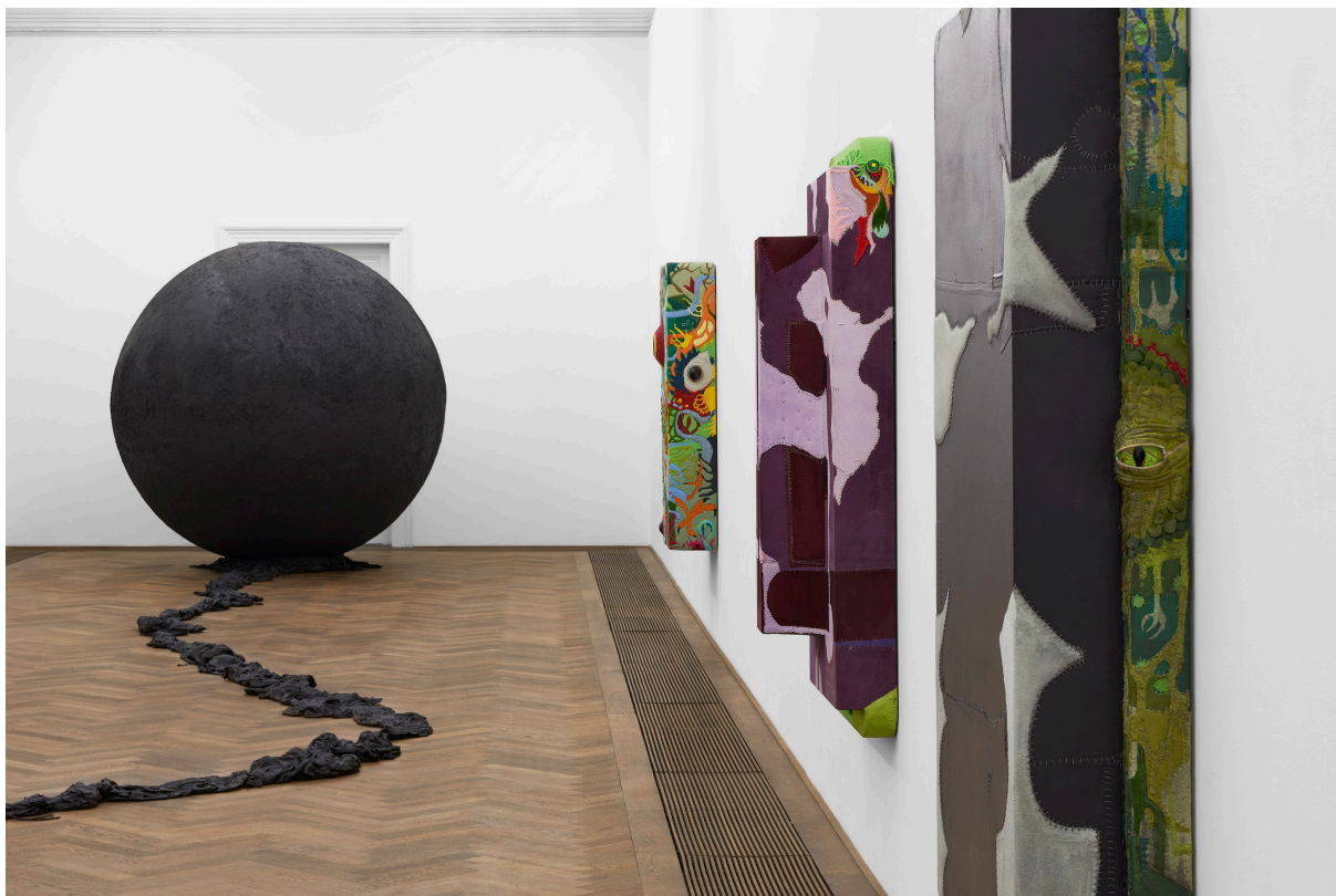
Installationsansicht, Pedro Wirz, Environmental Hangover , Kunsthalle Basel, 2022, Blick v. l. n. r. auf Exúvia , 2022, Coro de Princesa (Sumaúma) , 2022, Coro de Princesa (Seringa) , 2022, Coro de Princesa (Envira Preta) , 2022.