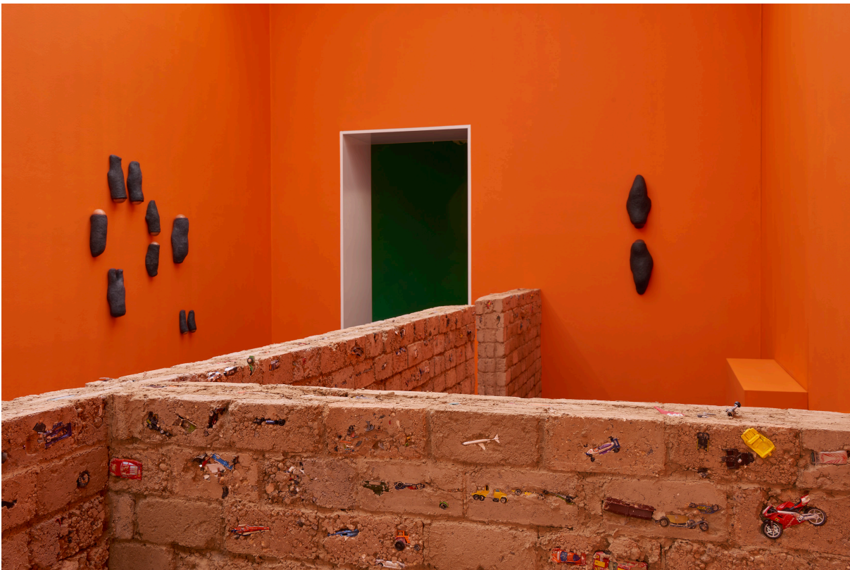
Installationsansicht, Pedro Wirz, Environmental Hangover , Kunsthalle Basel, 2022, Blick auf Our cities were built to be destroyed , 2016–2022 (vorne) und die Serie Sour Ground , 2022 (hinten). Installation view, Pedro Wirz, Environmental Hangover , Kunsthalle Basel, 2022, view on Our cities were built to be destroyed , 2016–2022 (front) and the series Sour Ground , 2022 (back).