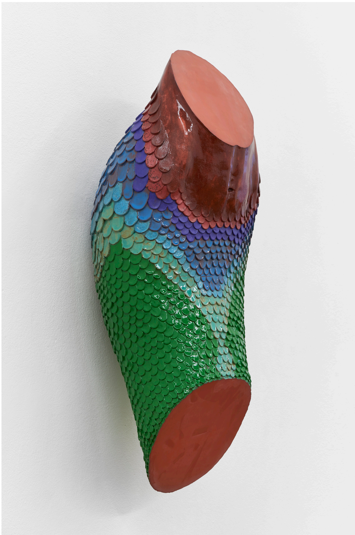
Installationsansicht, Pedro Wirz, Environmental Hangover , Kunsthalle Basel, 2022, Blick auf Bicho Abstrato (Iara) , 2022. Installation view, Pedro Wirz, Environmental Hangover , Kunsthalle Basel, 2022, view on Bicho Abstrato (Iara) , 2022.