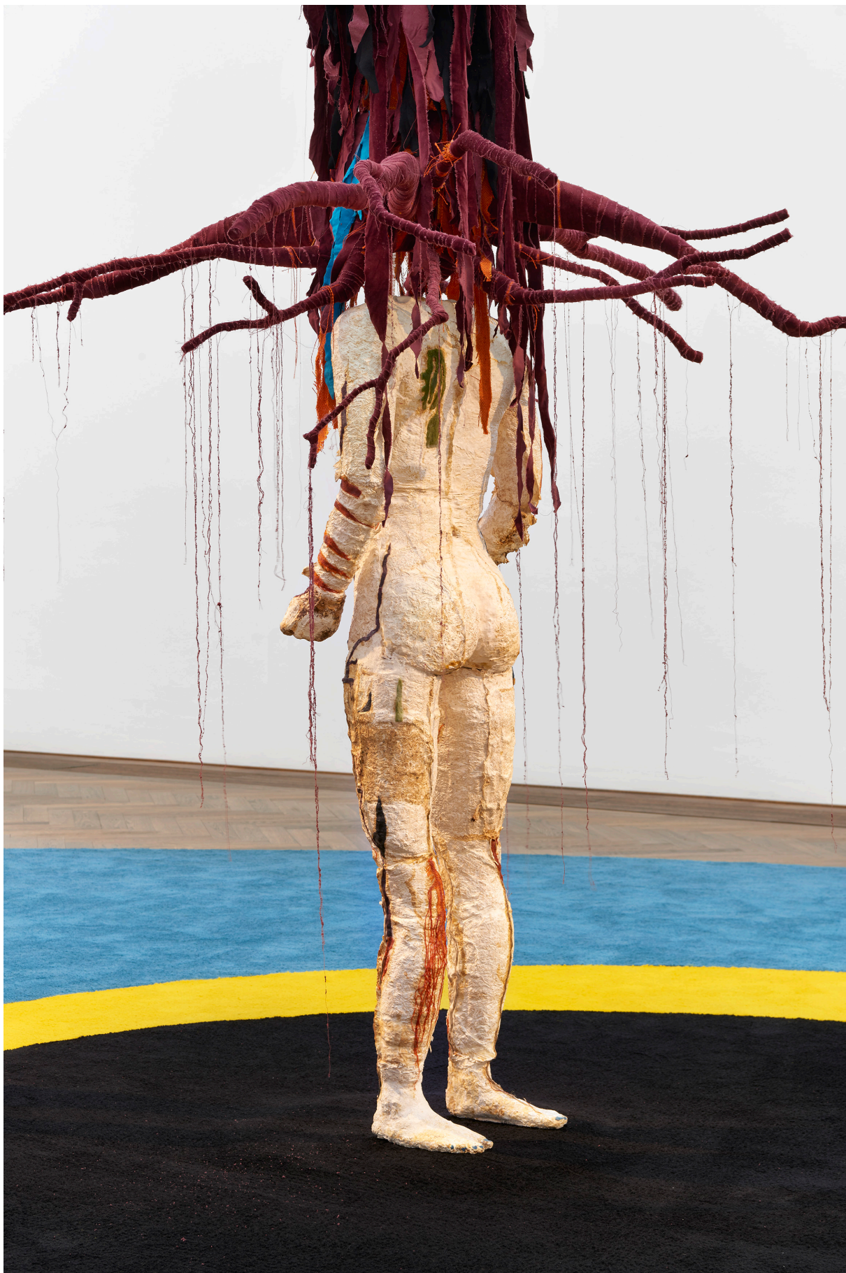
Installationsansicht, Pedro Wirz, Environmental Hangover , Kunsthalle Basel, 2022, Blick auf Chapéu Telúrico , 2022, und Ovo Espacial , 2022 (Boden). Installation view, Pedro Wirz, Environmental Hangover , Kunsthalle Basel, 2022, view on Chapéu Telúrico , 2022, and Ovo Espacial , 2022 (floor).