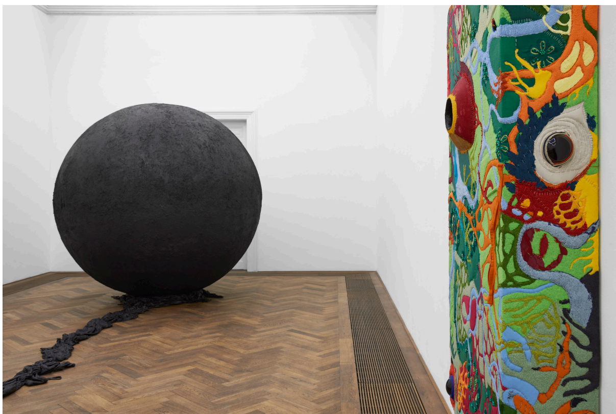
Installationsansicht, Pedro Wirz, Environmental Hangover , Kunsthalle Basel, 2022, Blick auf Exúvia , 2022 (links), und Coro de Princesa (Sumaúma) , 2022 (rechts).