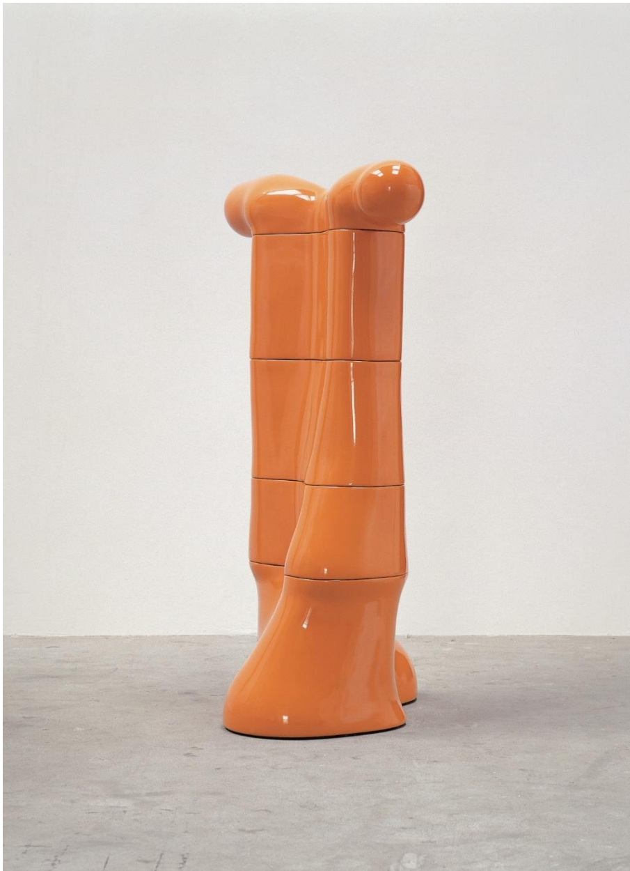
Joachim Bandau, Der Tänzer , 1968

Glasfaserverstärkter Polyester, Lack, 5 Teile / Glass-fibre reinforced polyester, lacquer, mixed media 147 x 88 x 57 cm