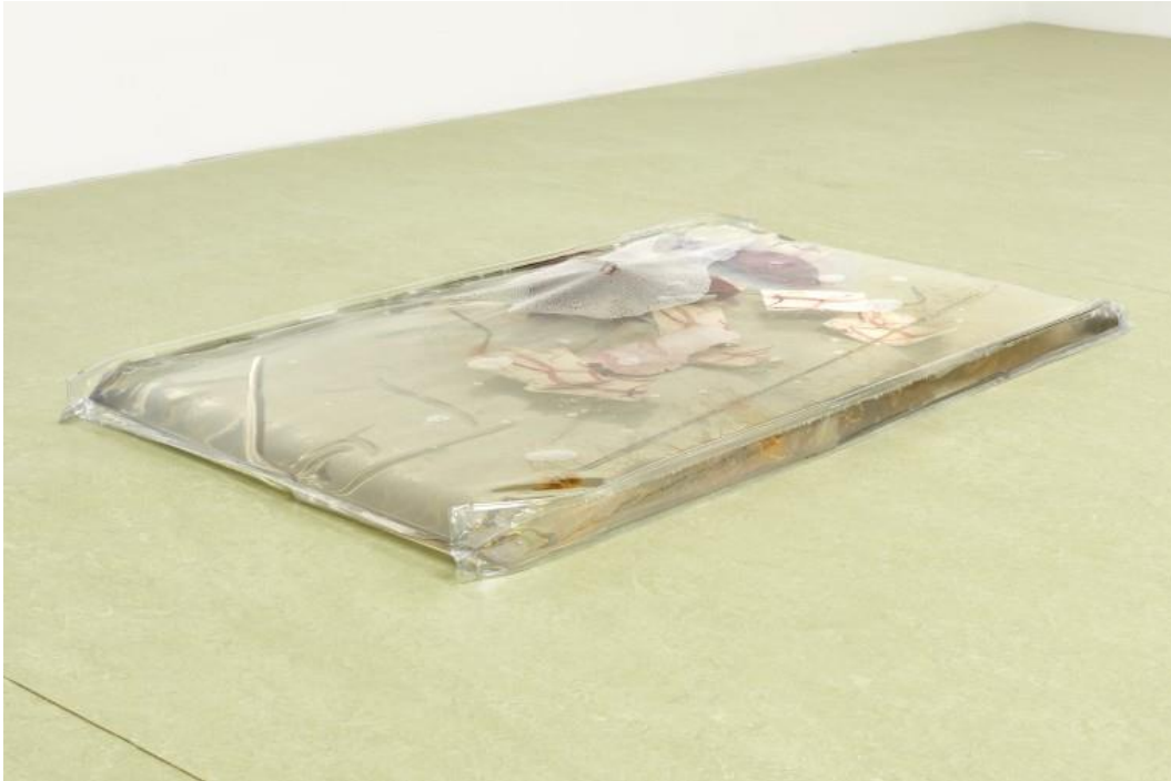
Olga Balema, Become a Stranger to Yourself , 2017 Fotografien, Latex, Silikon, Stahl, Stoff, Wasser, Weich-PVC / Fabric, latex, photographs, silicone, soft PVC, steel, water 139,7 x 76,2 x 7,6 cm