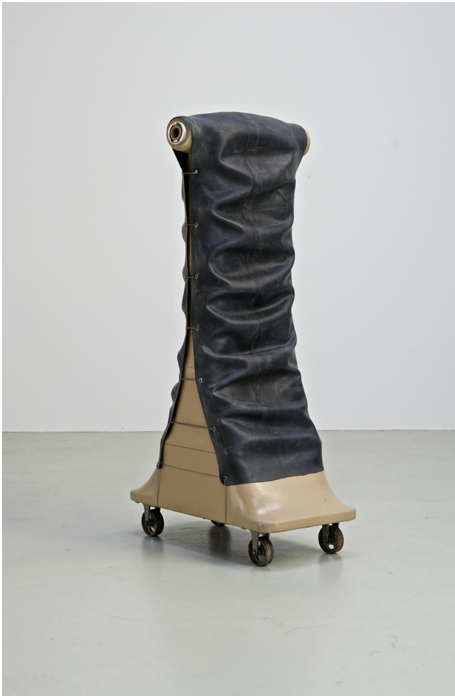
Joachim Bandau, Mannequin , 1971

Glasfaserverstärkter Polyester, Lack, 5 Teile / Glass-fibre reinforced polyester, lacquer, mixed media 196 x 76 x 105 cm