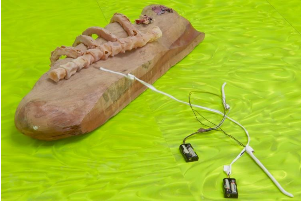
Olga Balema, A Thing filled with Evil Streams , 2016 Batterien, Holz, Mobiltelefon, Modelliermasse, Motoren, Stoff / Batteries, cell phone, latex, Magic Sculpt, motors, wood 78,7 x 20,3 x 1,8 cm