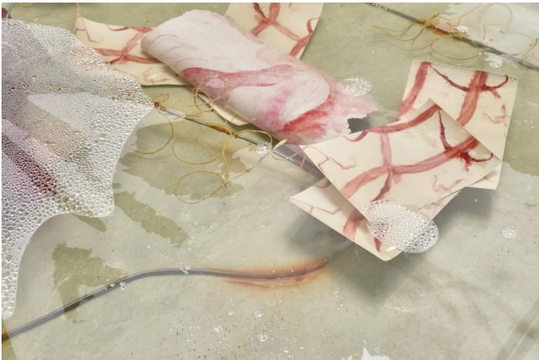
Olga Balema, Become a Stranger to Yourself , 2017 Fotografien, Latex, Silikon, Stahl, Stoff, Wasser, Weich-PVC / Fabric, latex, photographs, silicone, soft PVC, steel, water 139,7 x 76,2 x 7,6 cm