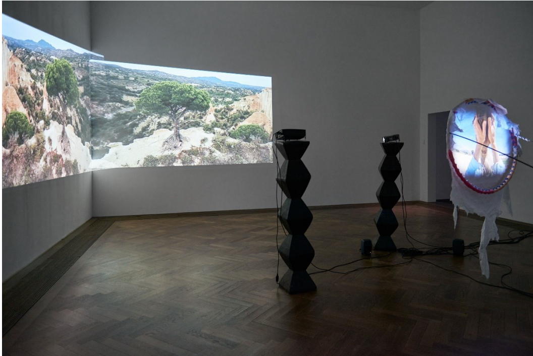
Raphaella Vogel, Installationsansicht, Ultranackt , Blick auf Fruit of the Hoop , 2018, Kunsthalle Basel, 2018.