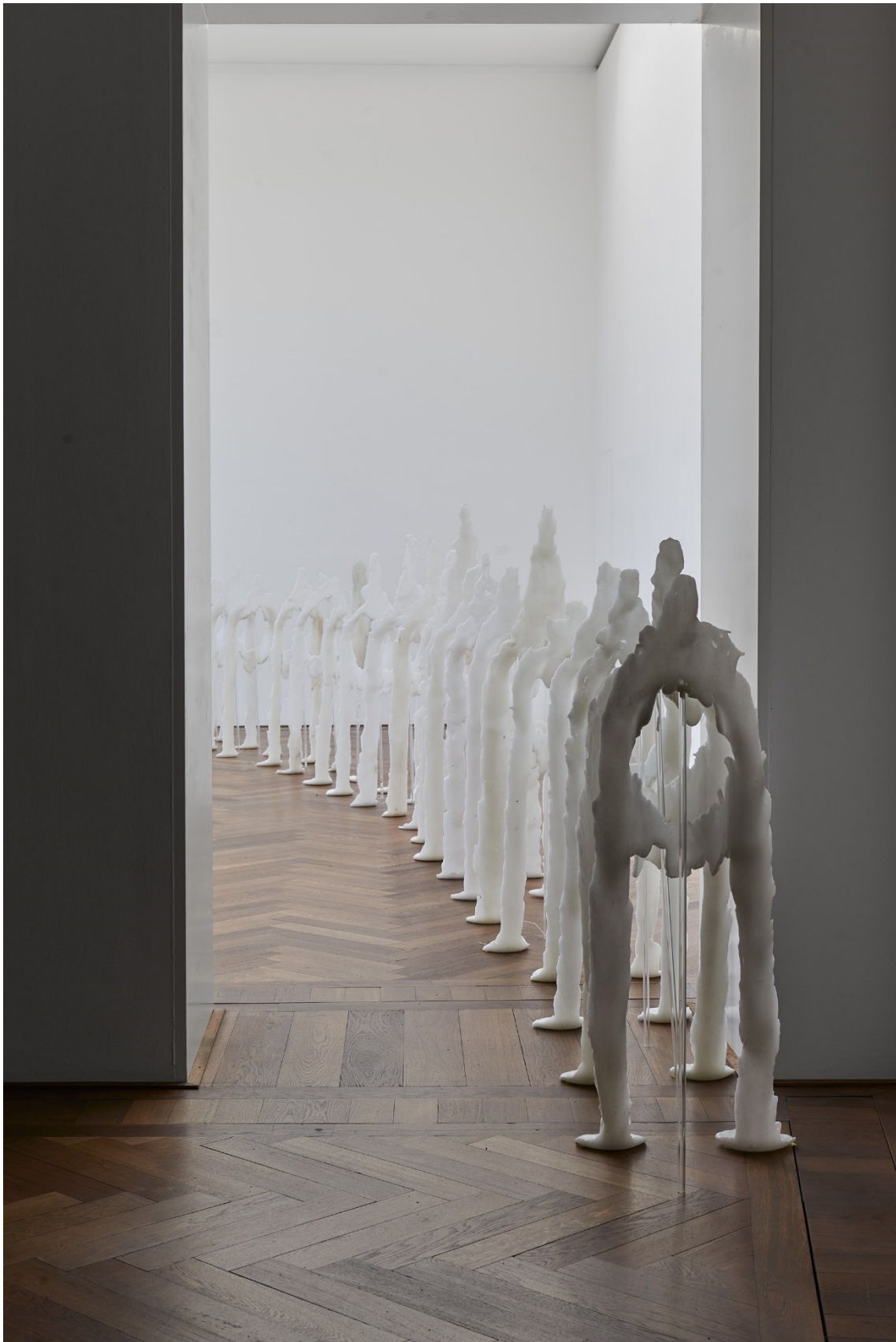
Raphaela Vogel, Installationsansicht, Ultranackt , Blick auf Uri , 2018, Kunsthalle Basel, 2018.