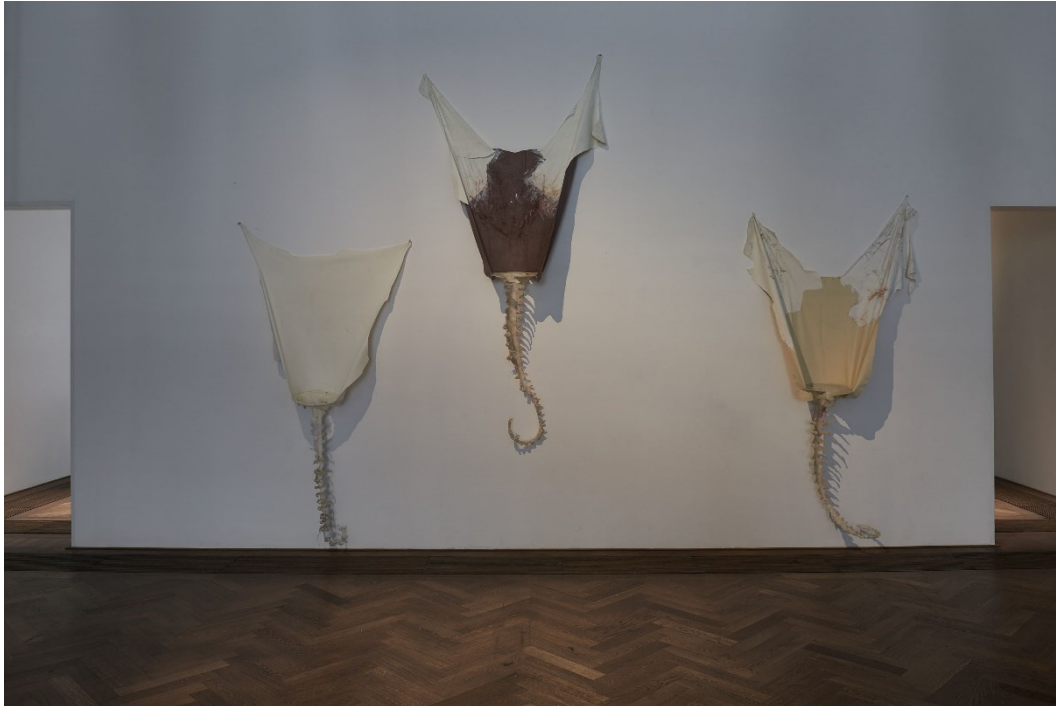
Raphaëla Vogel, Installationsansicht, Ultranackt , Blick auf Heidi , Vreni , Alma , alle 2018, Kunsthalle Basel, 2018.

Raphaëla Vogel, Installation view, Ultranackt , view on Heidi , Vreni , Alma , all 2018, Kunsthalle Basel, 2018.