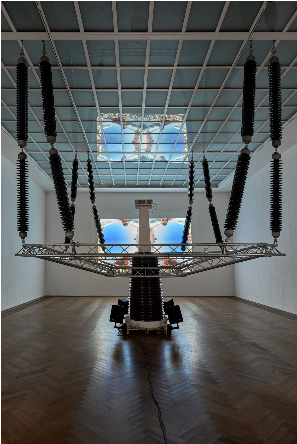
Raphaëla Vogel, Installationsansicht, Ultranackt , Blick auf Isolator , 2016, Kunsthalle Basel, 2018.