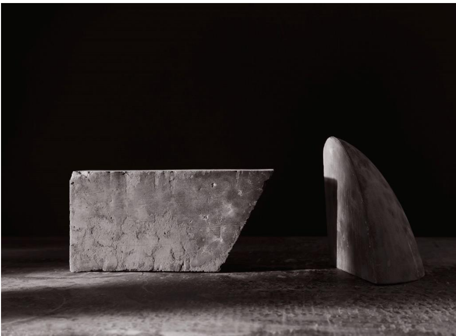
Erin Shirreff, Still (no. 7) , 2016 Archiv Pigmentdruck / archival pigment print