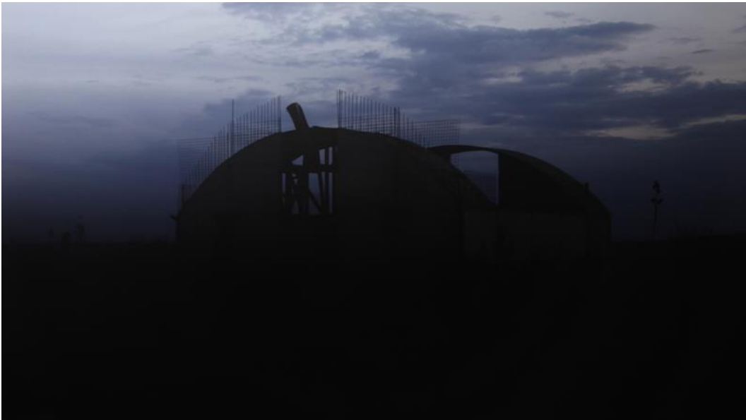
Erin Shirreff, Concrete Buildings , 2013-16 (Video Still)

All Arbeiten Courtesy die Künstlerin und Sikkema Jenkins & Co., New York / All works courtesy of the artist and Sikkema Jenkins & Co., New York