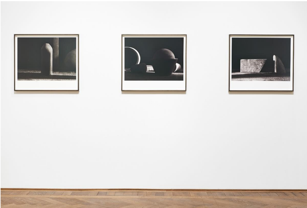
Erin Shirreff, Installationsansicht, Halves and Wholes , Blick auf Still (no. 3) und Still (no. 2) und Still (no.7) , 2016, Kunsthalle Basel, 2016. Erin Shirreff, installation view, Halves and Wholes , view on Still (no. 3) and Still (no. 2) and Still (no.7) , 2016, Kunsthalle Basel, 2016.