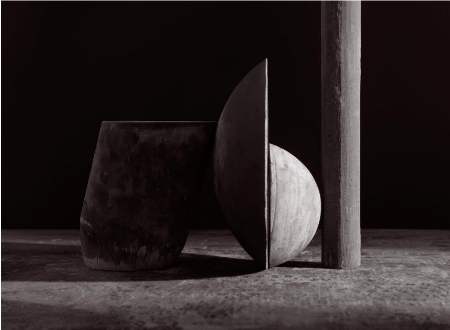
Erin Shirreff, Still (no. 5) , 2016 Archiv Pigmentdruck / archival pigment print