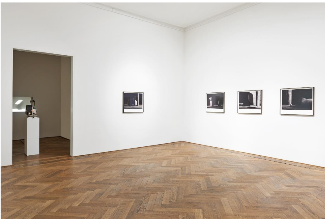
Erin Shirreff, Installationsansicht, Halves and Wholes , Kunsthalle Basel, 2016. Foto: Philipp Hänger / Erin Shirreff, installation view, Halves and Wholes , Kunsthalle Basel, 2016. Photo: Philipp Hänger