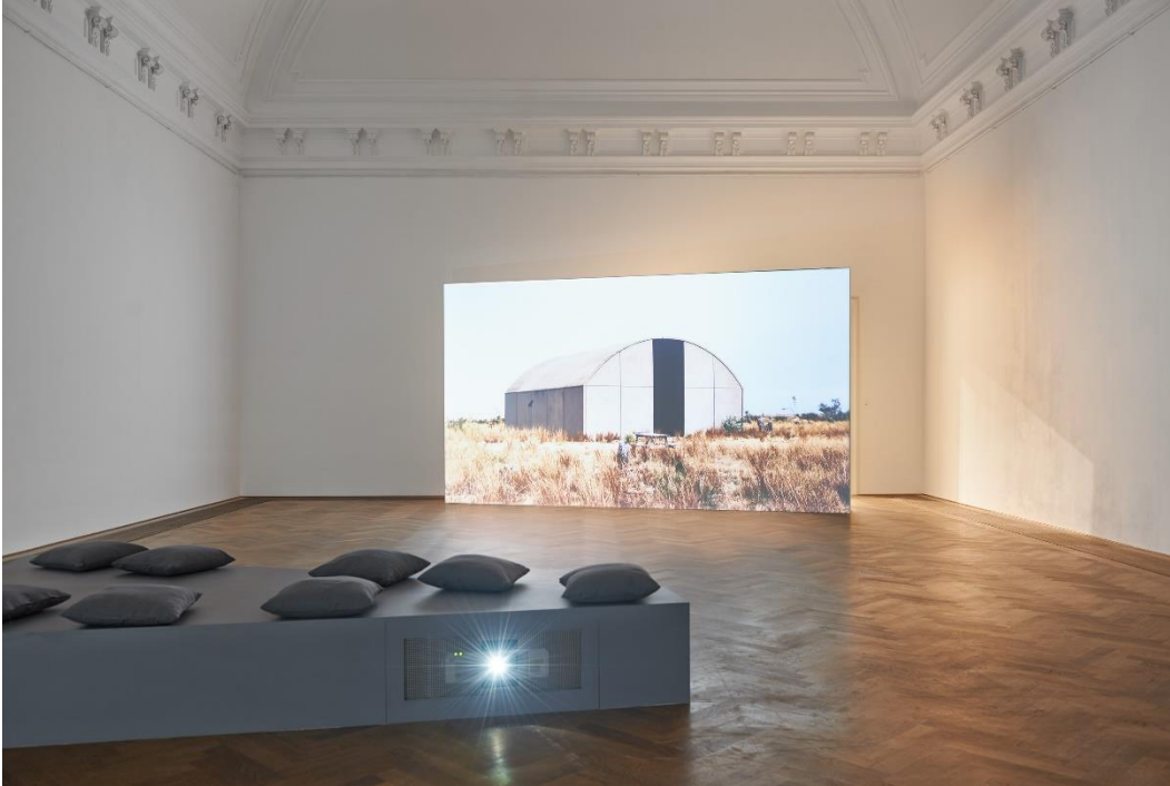
Erin Shirreff, Installationsansicht, Halves and Wholes , Blick auf Concrete Buildings , 2013-16, Kunsthalle Basel, 2016. / Erin Shirreff, installation view, Halves and Wholes , view on Concrete Buildings , 2013-16, Kunsthalle Basel, 2016.